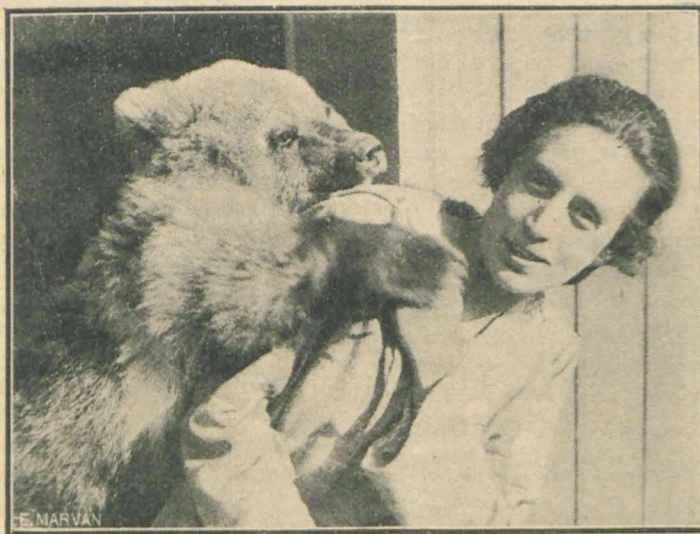
Un „atac bruscat”... dar periculos

Sosit pe domeniu, a rămas gură-cască văzând că are să