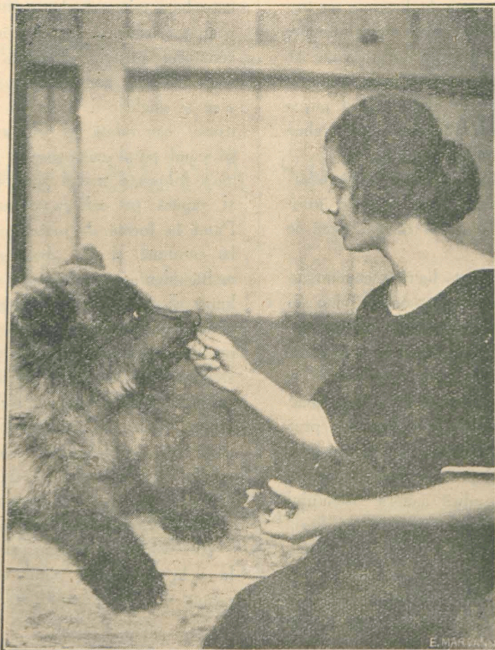
Hrănirea micului pensionar al prietenului și colaboratorului nostru.

Să abandonăm deci, însă nu fără ai plânge, pe nenorociiți „emoționați” și să căutăm a stabili împreună cu vânătorii mai calmi, modul, cum trebuie împușcat epurele.