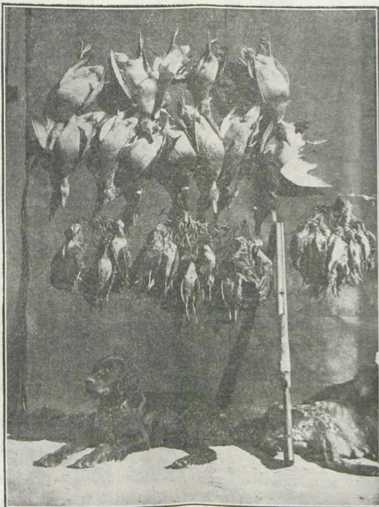
O vânătoare în delta Dunărei