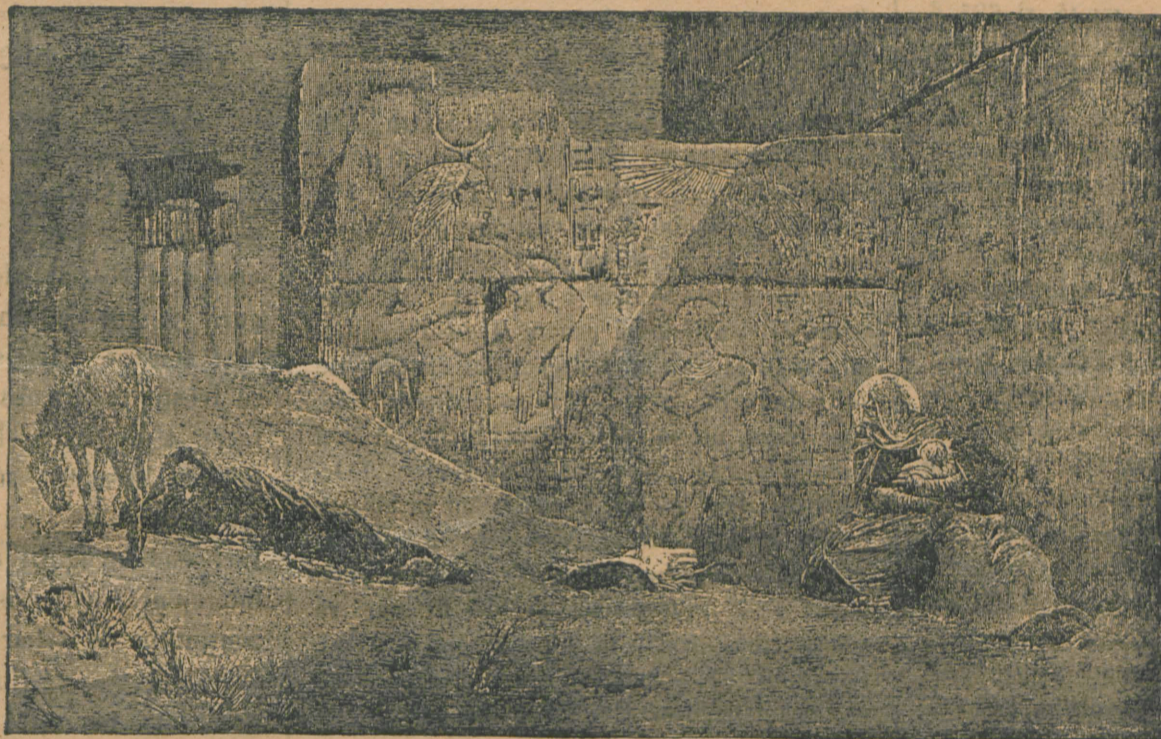
Fuga în Egipt.

Toți câți au fost judecați, începând dela membrii comitetului național și până