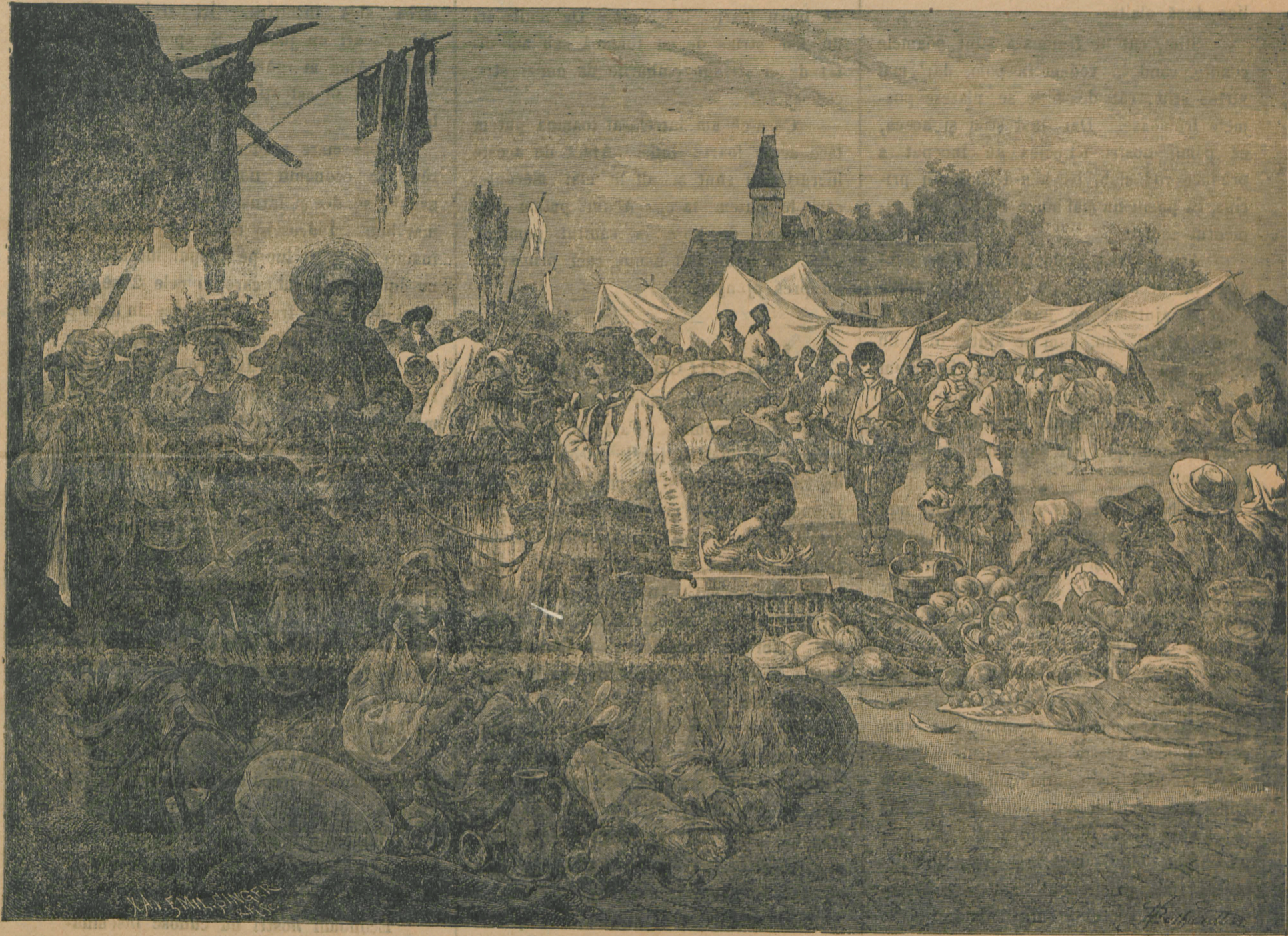
Un târg în Valea-Hățegului.

După-ce au isprăvit cu târguitul, târgoveții se îndreaptă rind pe rind spre cortul mai din fund, din dreapta, unde se vinde vin, bere și rachie; după osteneală și multă vâl-mășeală îi cade omului bine câte un păhar de beutură și un scaun de odihnă. Unii mai trag câte un păhar și peste sete, și-și fac voe bună și-și petrec, »ca în târg« vorba Românului. Ear' veselie o măresc țiganii lăutari, cari trag când câte una duioasă, când