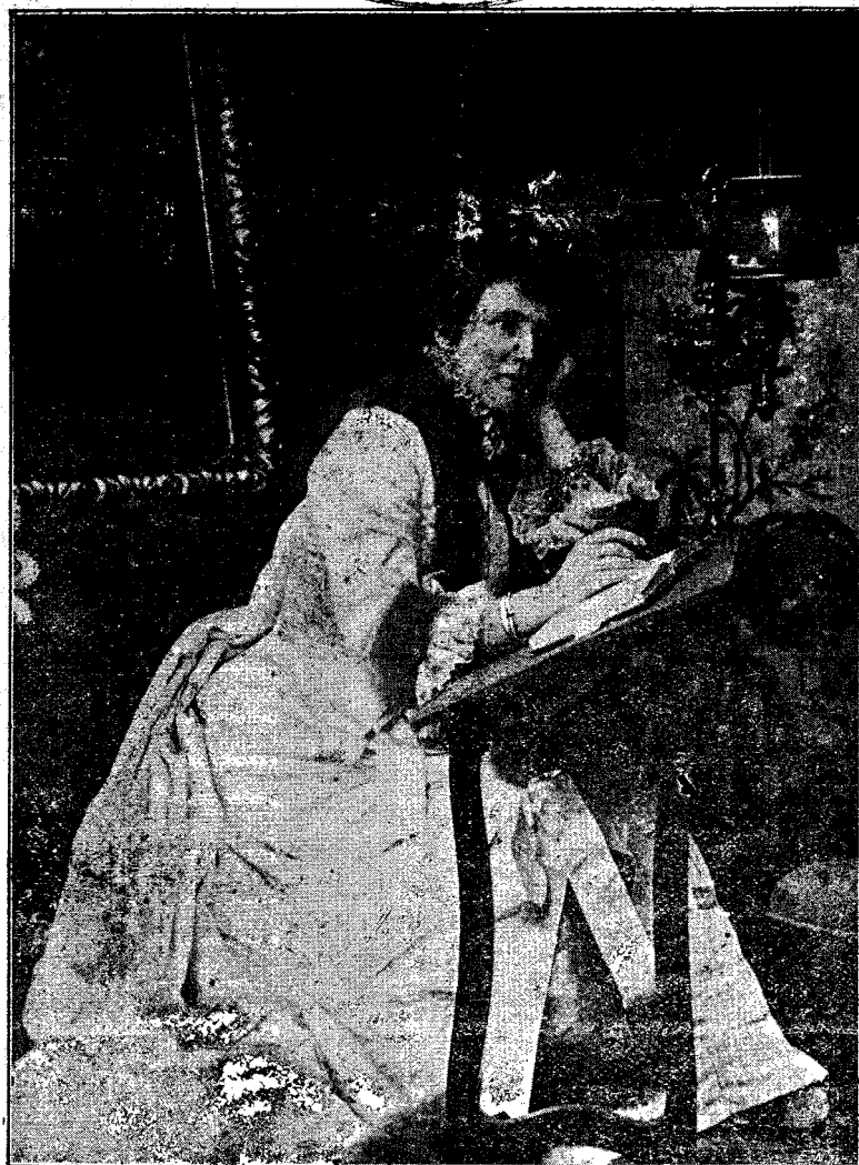
CARMEN SYLVA (Vezi: „Foiţa“).

Pentru noi Români anul 1902, pe teren economic, a fost bun. Inregistrăm în el o recoltă mijlocie bună, băncile româneşti prosperează, reuniunile noas-