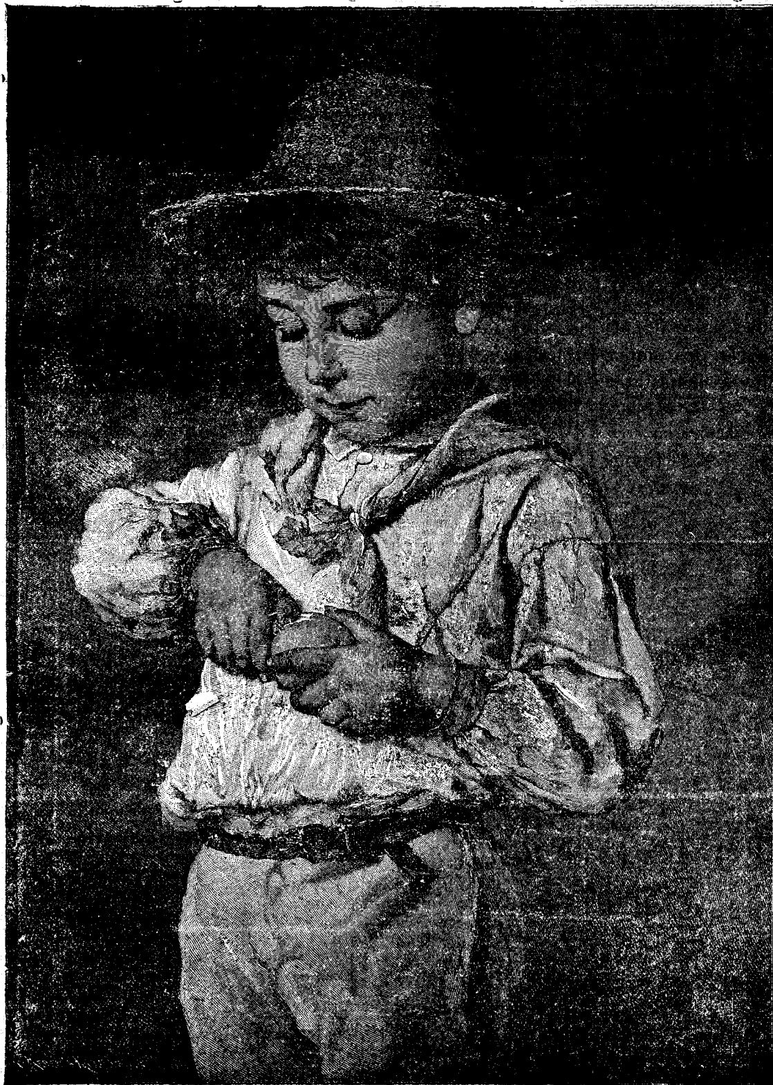
Prima portocală (Vezi: „Foita“)

Recolta să se facă la timp, nici prea curând însă nici întârziând prea mult. Adăpostirea ei hotărăște asupra valorii recoltei. Dacă avem grâne, trebuie duse la vânzare curățate și sortate (alese) și îndată ce căpătăm un preț po-