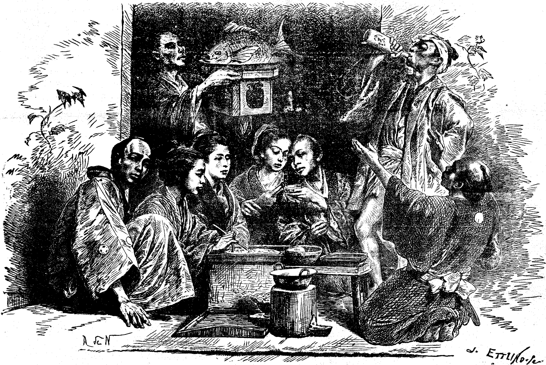
Japonezi la masă.

și doi tineri, ce isprăviseră 3—4 clase gimnasiale. Toți aceștia, să înțelege, făceau pe cuminții satului. Ei împărțiau sfaturi în toate treburile, chiar și în de-acelea despre care idee n'aveau. C'o vorbă scurtă ei erau advocații, ei medicii, ei judecătorii, ei sfătuitoarii co-