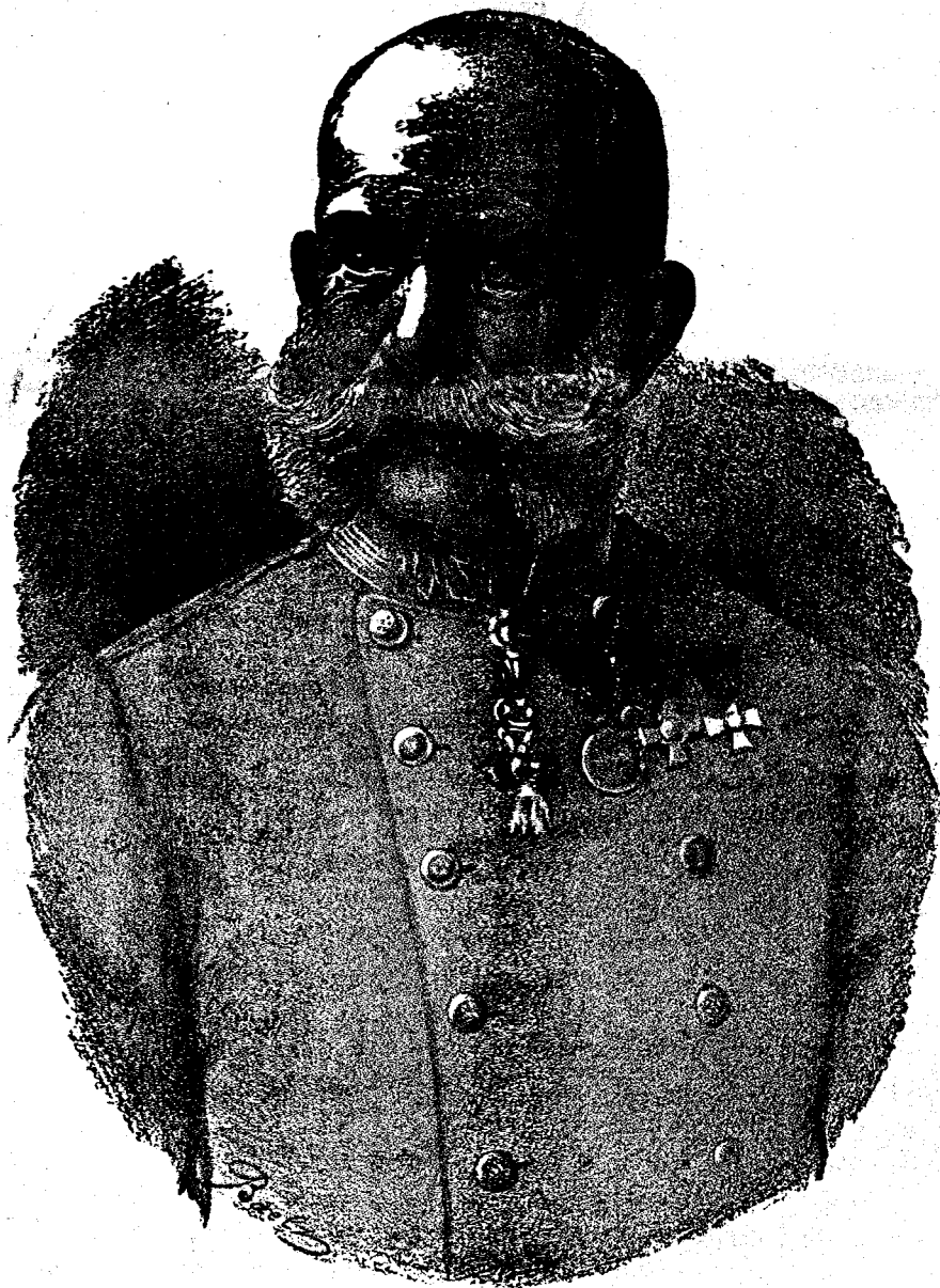
Împăratul și Regele Francisc Iosif I.

»În toastul seu (dl Désy ) a accentuat, că pe lângă limba sa maternă cea mai plăcută îi e limba română , pe carea o vorbește, deși, cu regret o constată aceasta, literatura ei nu o cunoaște. În mijlocul poporului român și-a petrecut și-și petrece activitatea etății de bărbat și a învățat să stimeze perseveranța, modul de cugetare uman și sentimentele umane ale poporului român . E cel mai mare și cel mai adict amic al buneii înțelegeri fră-