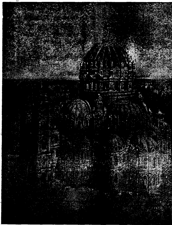
BISERICA CEA NOUĂ DIN NEW-YORK.

și îngrășăminte artificiale în abundență și aici am dat de cel mai mare progres în agricultură. Cu totul altfel stau împrejurările în Vest, unde se face înainte de toate o cultură extensivă de grâu. În Dakota nordică, Minnesota s. ex. sunt câmpuri peste câmpuri de grâu. În întreagă regiunea Missouri și Mississippi pământul este enorm de roditor, și cu toate-că aici se cultivă neîntrerupt grâu după grâu, totuși pământul se poate numi încă aproape virgin. Aici se arată adevărul americanism, care din ceea-ce există stăruie să scoată tot cât e posibil. Fermele, 200—250, aparțin întreprinzătorilor capitaliști, care sunt și în posesiunea căilor ferate și a grânelor