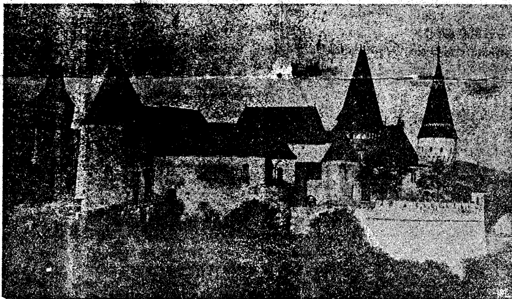
CASTELUL DIN HUNEDOARA

Luminarea și bucuria și fericirea ce Vă stăpânește acum, în srbătorile