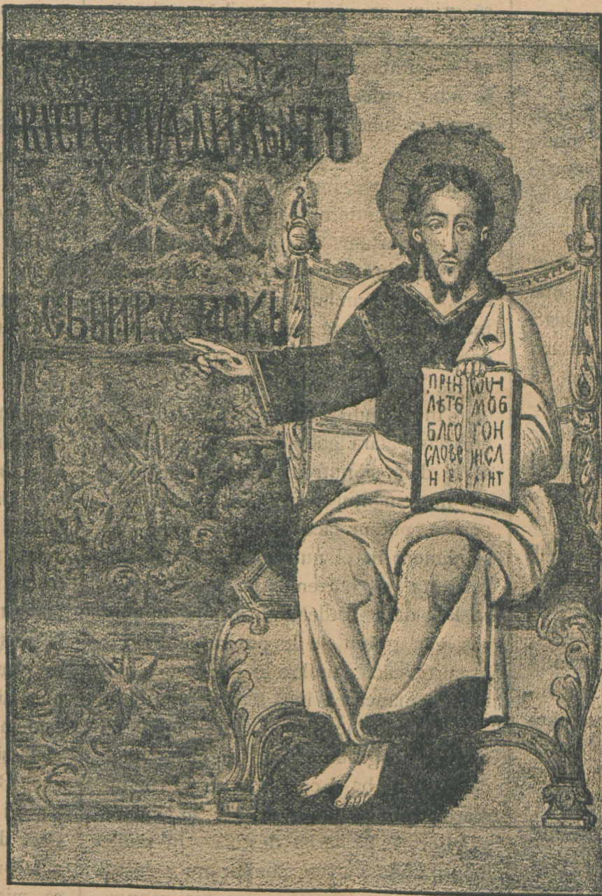
Steagul oștirii muntenești la încunjurarea Vienei.

Inscripția bine a prevestit, căci vitejia dreaptă, vitejia creștinească a învins asupra păgânilor cutropitori.