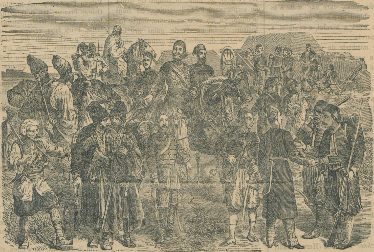
Tipuri din armata turcească.

În fața acestor pași ai puterilor europene Grecia a început a se înarma din răzputeri și a-și trimite toată armata la granița dela meazănoapte, în Tesalia, unde este mărginașă cu Turcia, amenințând că va declara războiul Turciei.