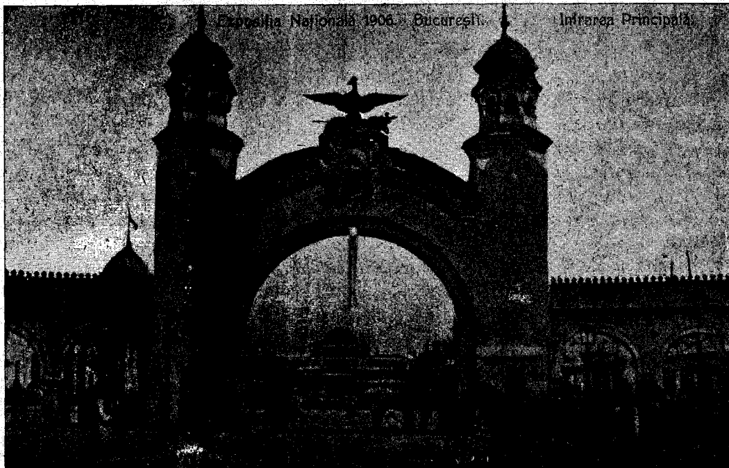
Poarta Expoziției din București (întrarea principală).

Pentru a treia oară să întrunește »Asociațiunea« noastră în adunare generală în Brașov, după un restimp de 23 ani dela întrunirea a doua, și de 44 ani dela cea dintâiu. Adunarea din a 1883 s'a distins prin hotărârea înființării școalei civile de fete din Sibiiu, care a adus servicii așa de însemnate societății noastre și care să socotește cu drept cuvânt ca un mărgăritari al instituțiilor noastre școlare. Și mai însemnată însă, atât prin numărul și starea socială a participanților, cât și prin înălțimea problemelor dezbătute și a entuziasmului, ce a domnit într'ansa, a fost adunarea din a. 1862, ținută tot în localul, în care ne