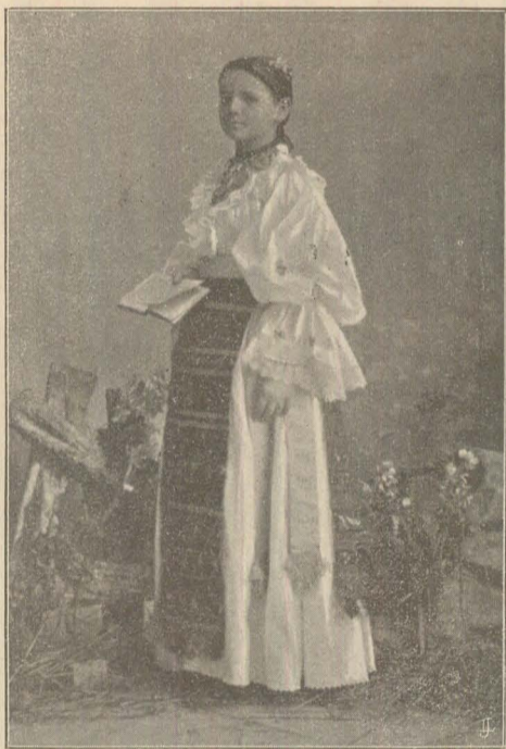
(O fetiță coristă din Bistrița).

Nu sus, nu sus la cei avuți In norii fumului perduți Se nasc fecundele vîrtuți ! Poporul ce suspină jos, E singur valea roditoare, In care se creșcă grâu și floare Bun și frumos . . . .