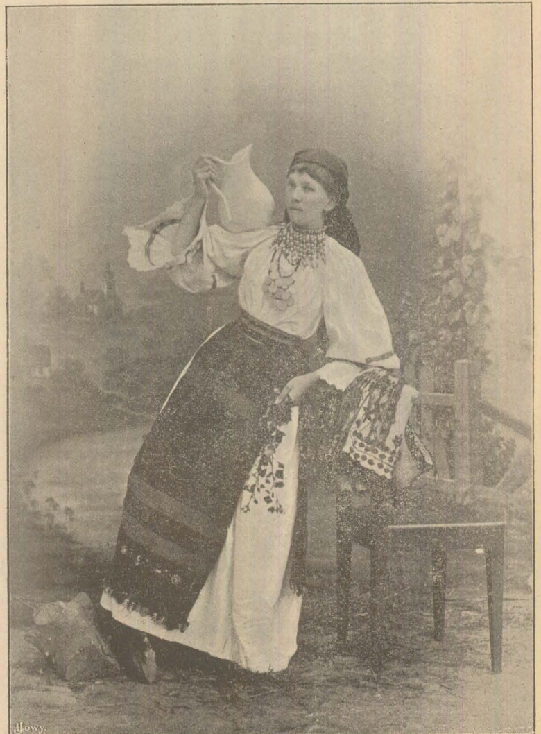
(O nevăstuță din Năsăud).