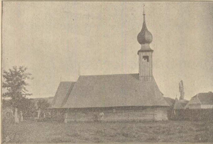
(Biserica cea vechiă.)

Atunci pe la anul 1700, le donă comuna română bisericăscă din Cușma o bisericuță vechiă, mică de lemn și Români bistrițeni o aduseră și o puseră »la hrubi«.