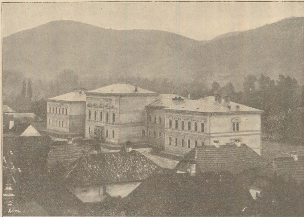
(Gimnasiul superior fundațional din Năsăud.)