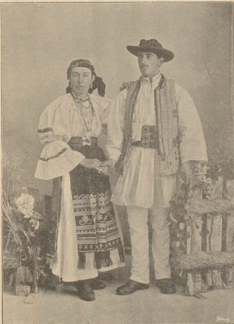
(O părechiă tinărá din Șoimuș).

Țeranul însē rēmâne fidel limbei sale, legi sale, portului sēu, obiceiurilor sale. Țeranul dară este factorul cel mai principal al unei națiunî.