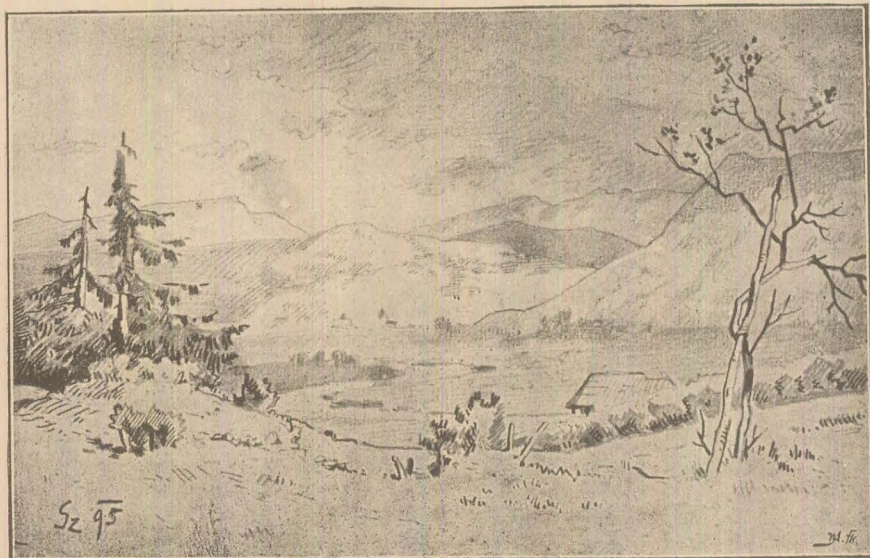
Valea Șieului spre sud dela Bistriȕă în Ardél.

Colo 'n josul mai în jos Colindăm dómne colinda*) Este o dalbă mânăstire