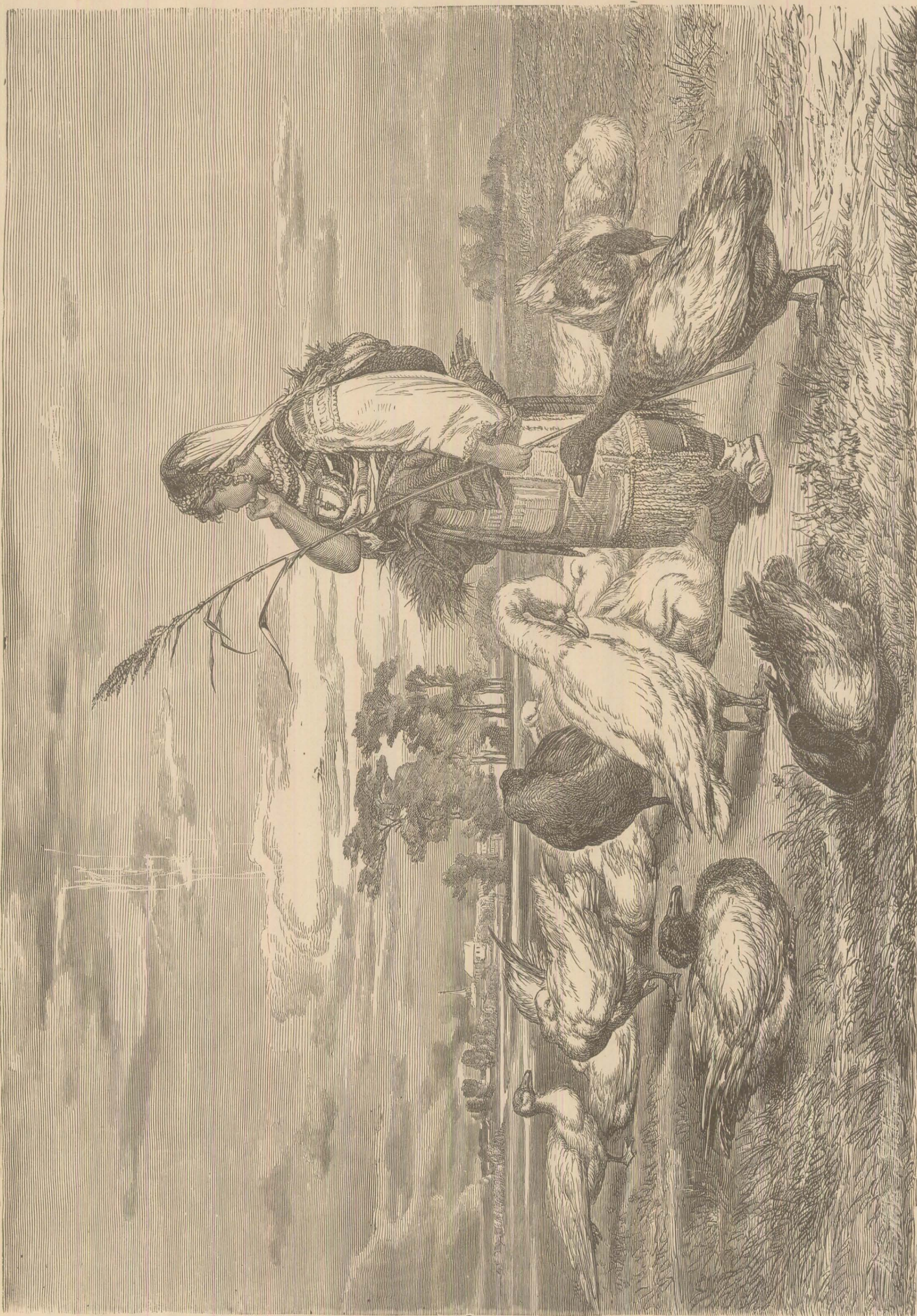
O fată ce pasce găsele.