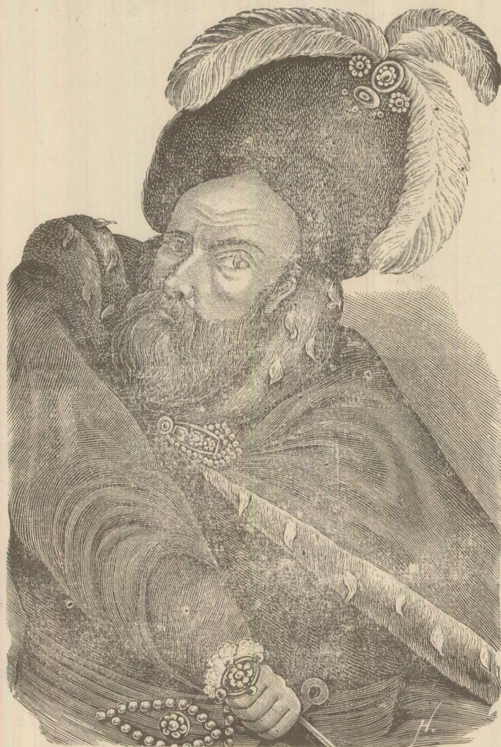
Ioan Vodă cel Cumpl.

Zoe se gādea: Cum se pôte se mē fi înșelat așa de tare în Silviu acesta. Înī părea așa de eloquent, așa de plăcut mai înainte și étă-l acum sdrobindu-mī tóte iusiuinile. Orī pôte că-l vedeam numai pe el și numai adī când il vēd față în față cu un om de talia generalului, il pot apreția după merit?!