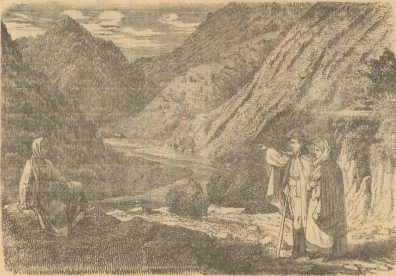
Un pas prin munții noștri.

Femei cu funcțiuni barbătesc se înmulțesc și în Anglia. În