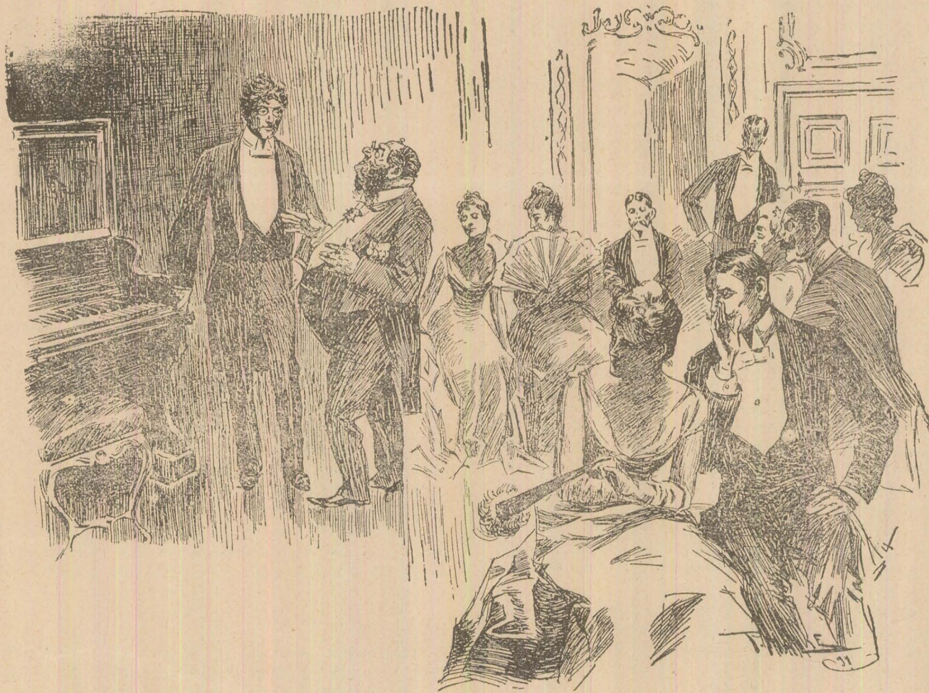
Petrecere de casă.