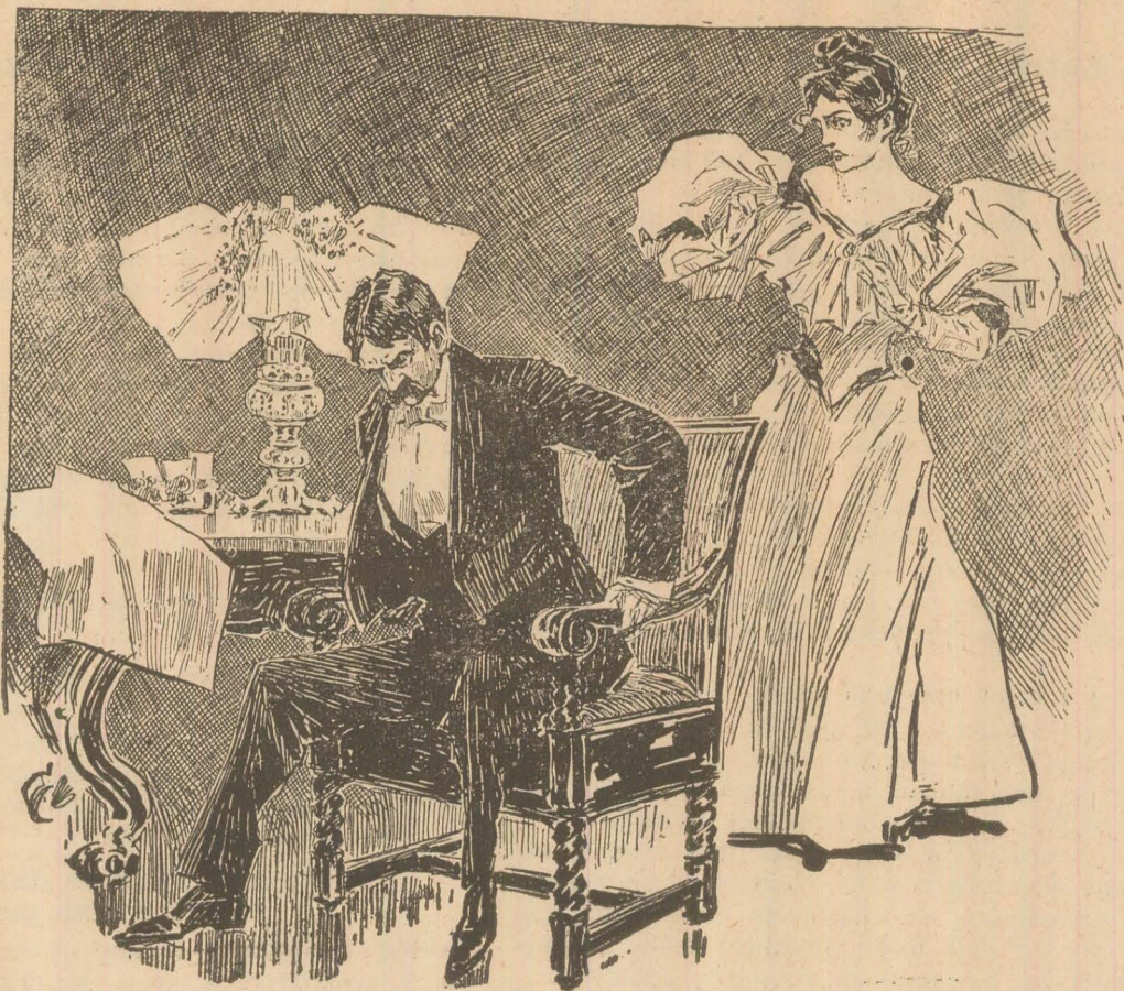
O scenă fortunôsă.