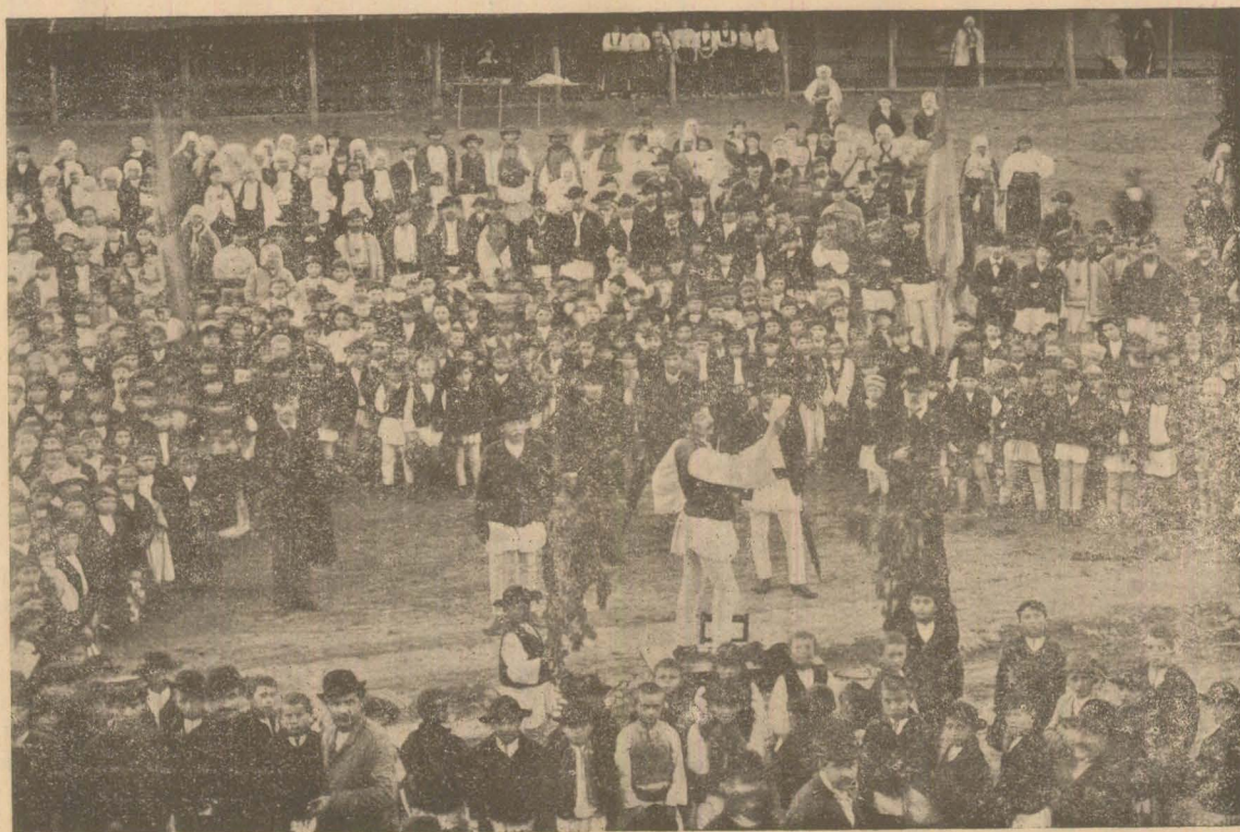
3/15 Maiu la Seliște.

Pentru publicațiunile de preste tot anul (de 24 orı) tot după 50 cuvinte cu litere garmond se compută 1 corónă, ér cu litere mai gróse duplu.