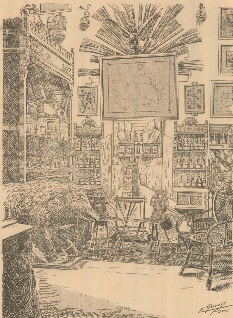
Expoziția produselor forestiere de pe domeniul coróniei din România.

„Vino Anuța!“ — îi dicem — și tăcuți, călcăm pardosea