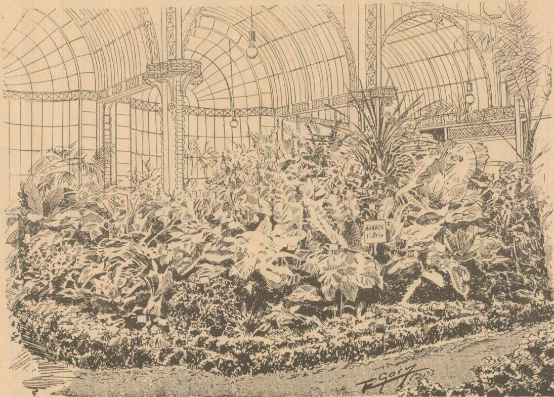
Esposiția de plante anuale și vivace la Paris.