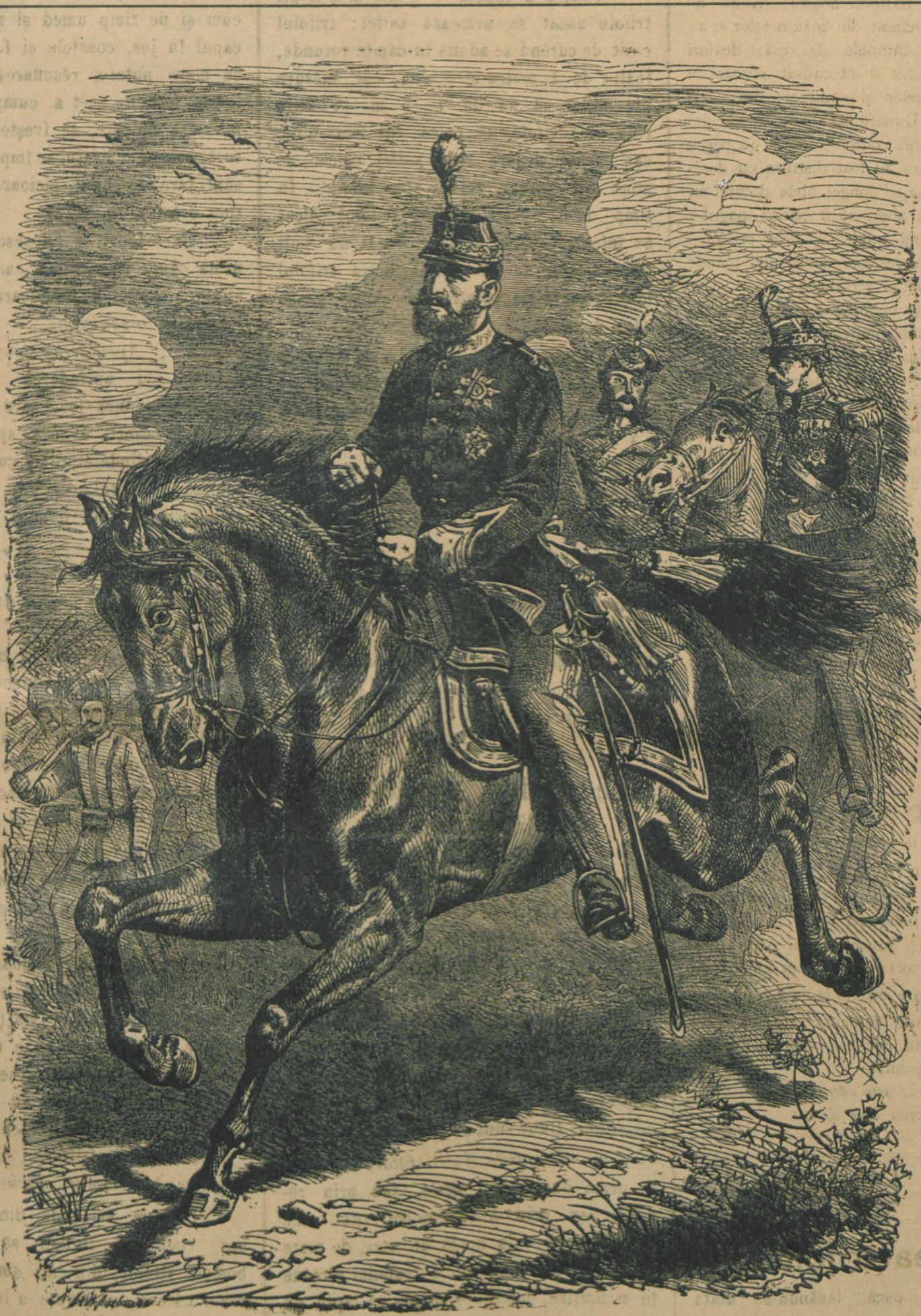
Regele Carol al României.

Mare a fost El în timp de războiu, dar' tot atât de mare a fost și este în timp de pace.