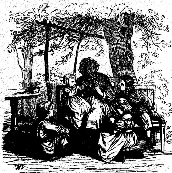
Bunica și nepoții.

— Îți mulțumesc, bărbățele. Apoi urmează un