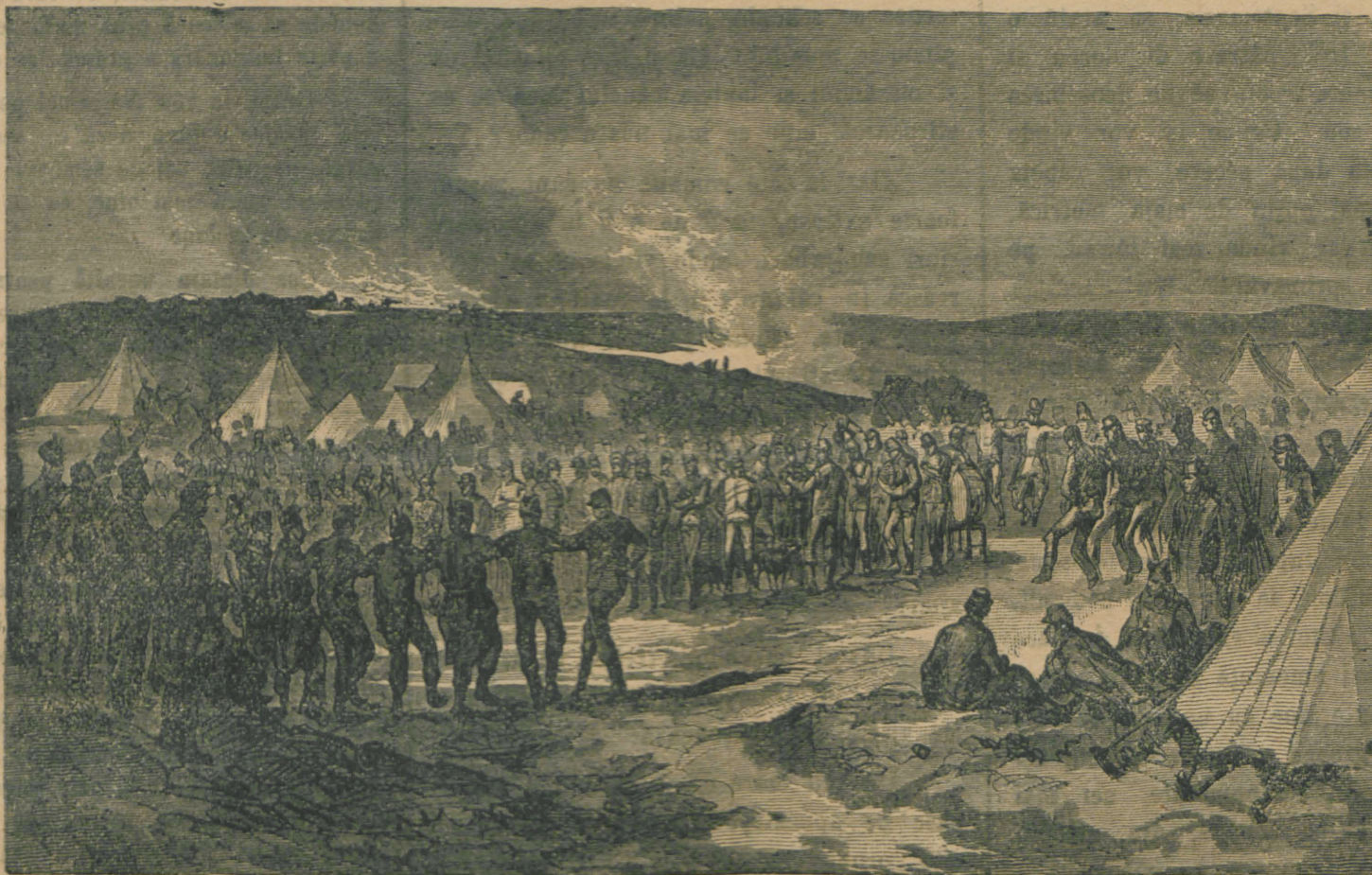
Hora dela Plevna.

Sînt speculanții dela bursă, indeosebi Jidanii cu averi de milioane, cari învîrt lumea după-cum le vine la socoteală și întru nimica le este lor de soartea