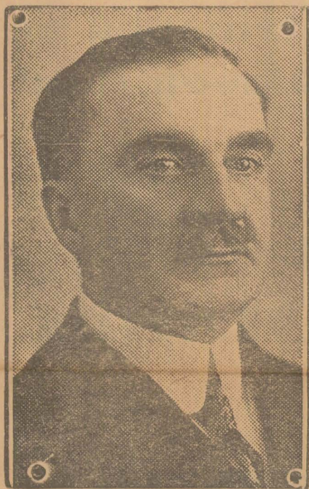
D-I IULIU MANIU

Mai ales în zilele grele trebuie să se manifeste puternic conștiința cetățenească.