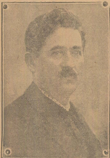
Dr. ION MIHALACHE. Președ. Part. Național Țărănesc.