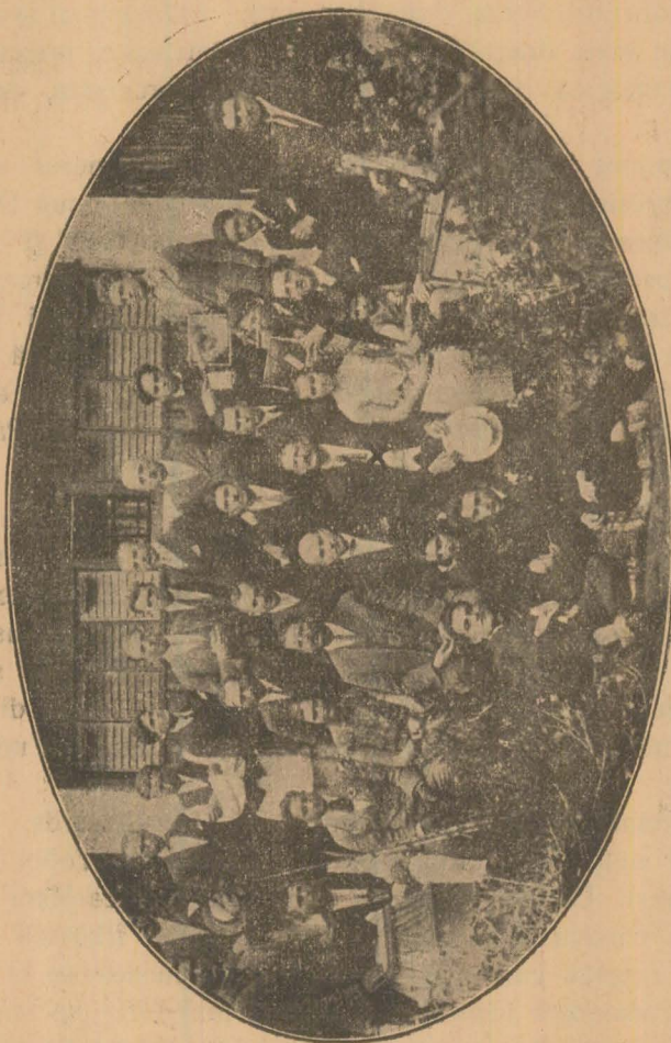
Comisiunea de examinare și absolvenții cursului apicol.

vară? Vin dragă, vin, numai să-i primiți bine! D-zeu să-i aducă Domnule Director, ca să ne mai cânte în biserică și să ne mai facă vre-o zi de veselie.