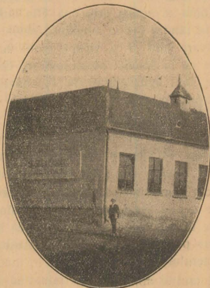
Un colț al școlii unde s'au ținut cursul teoretic.