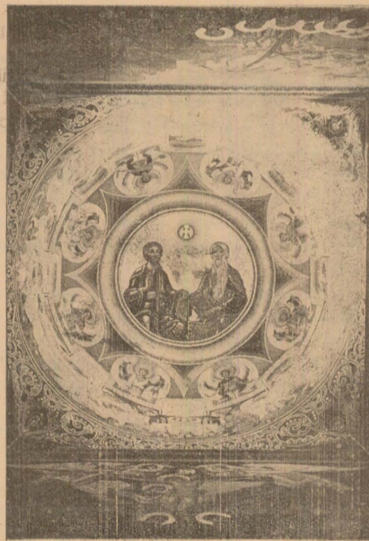
Icoană din biserica Bradului