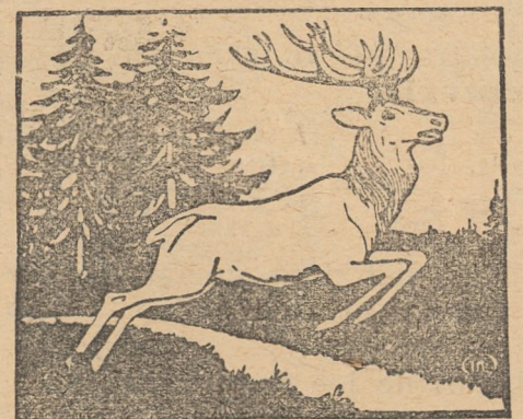
(423 b) 1—2