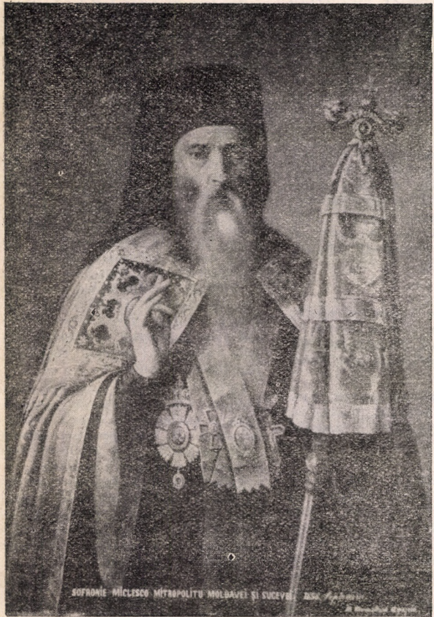
Mitropolitul Sofronie Miclescu al Moldovei (1851—1860)

urile dintre noi și reintrodu în mijlocul nostru strămoșeasca frăție. Fii simplu, Măria Ta, fii bun, fii demn cetățean; urechea ta să fie pururea deschisă la adevăr și închisă la minciună și la lingușire. Porți un frumos și scump nume, numele lui Alexandru cel Bun. Să trăiești dar mulți ani ca și dînsul; să domnești ca și dînsul!“.