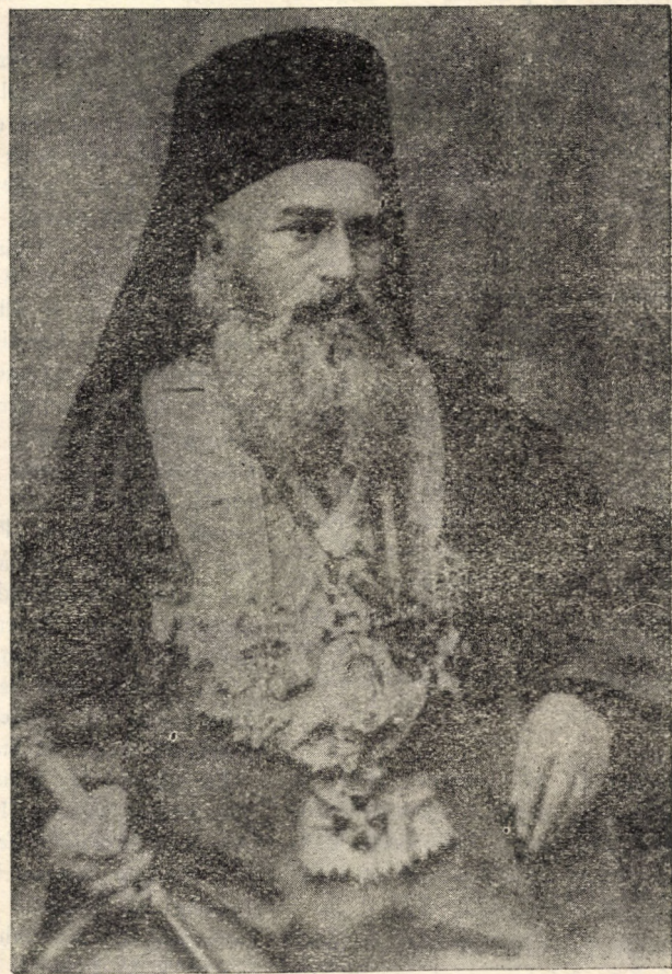
Episcopul Melchisedec Ștefănescu al Romanului (1879—1892)

Deci, dacă pentru românii din Principate a sosit o epocă, care îi cheamă la „unire“, aceasta este o dovadă că ei sînt pe calea progresului universal al omenirii, că ei sînt chemați a se sui pe scara acestui progres veșnic, care este cea tainică scară, pe care a văzut Iacob că una cerul cu pămîntul“. Stă-