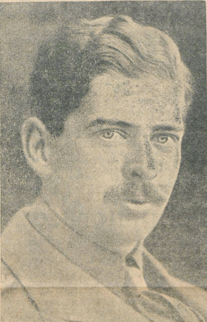
M. S. Regele Carol al II-lea al României

mântărea ce o slăbea zi de zi, fiind îndreptată spre ținta salvatoare.