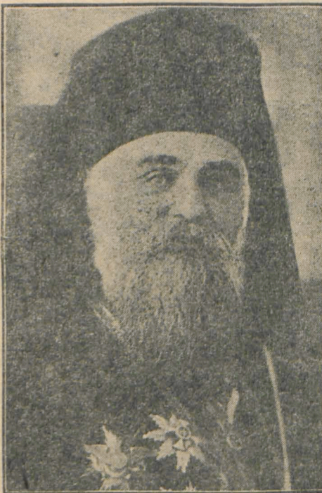
† J.P.S.S. Dr. MIRON CRISTEA fost Patriarh al României și P.Im-Ministru misiune creștinească de slujitor

a luat conducerea guvernului Renașterii Naționale și prin aceasta n'a părăsit cu nimic înalta