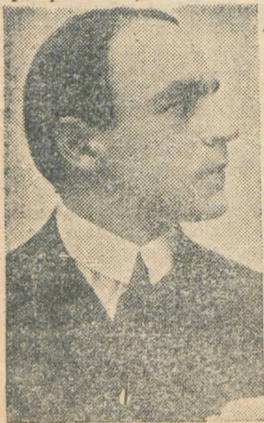
D. Armand Călinescu Președintele Consiliului de Miniștri

Toată suflarea Românească a răspuns cu toată căldura la apelul de a se înscrie în Front, apel lansat de M. S. Regele, care prin noul organism politic a trasat linia de conduită pe care trebuie s'o urmăm pentru redresarea Națiunii, consolidarea și prosperarea țării.