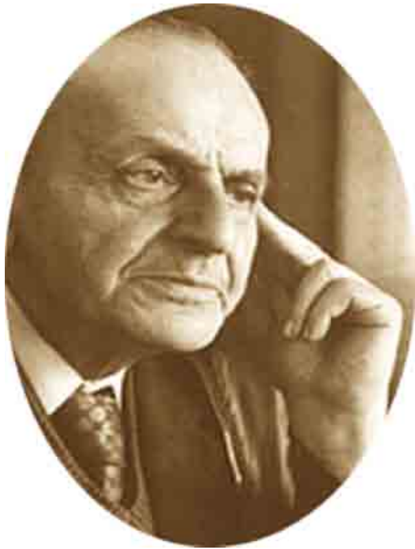
Constantin Noica (1909-1987)