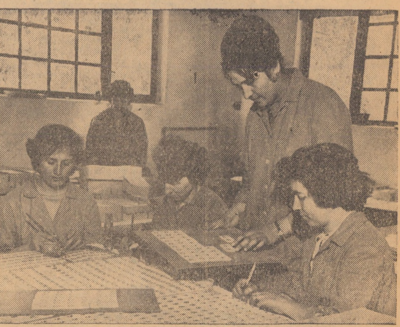
În cadrul întreprinderii industriale Medias, într-unul din ateliere, pe lîngă alte reperi din masă plastică se execută jocuri de remi. În fotografie: aplicația manuală a culorilor pietrelor de joc