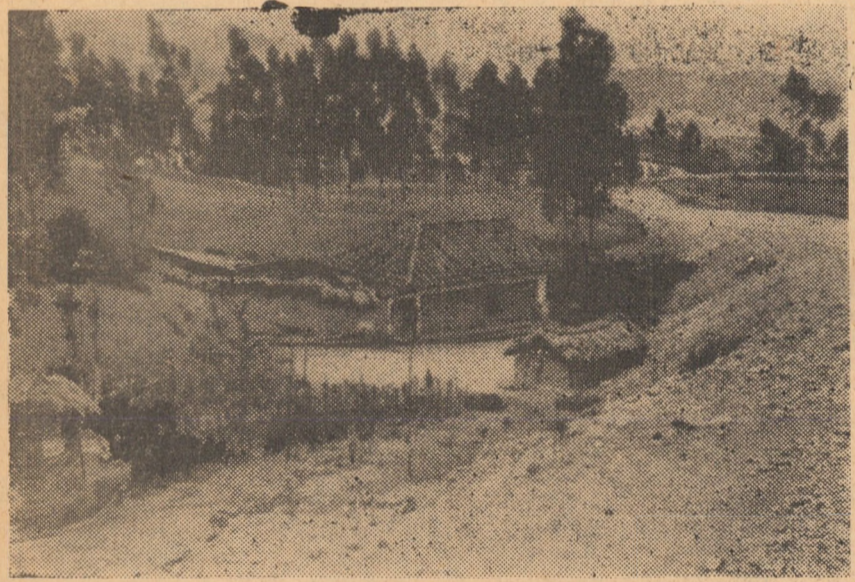
ECUADOR: Locuințe țărănești într-unul din satele țării

Postul de radio Bamako a anunțat că în urma hotărârii Comitetului eliberării naționale au fost dizolvate toate organizațiile politice (printre care Uniunea muncitorilor, Uniunea femeilor și alte organizații), care fuseseră încadrate în Partidul Uniunea Sudaneză, condus de fostul președinte al țării, Modibo Keita.