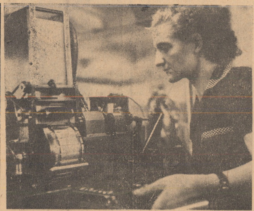
În secția stiloarei a fabricii „Fiamura roșie” din Sibiu, la o mașină se efectuează umplerea tuburilor cu pasă pentru pixuri

„Frontul Unității Socialiste trebuie să găsească mijloacele cele mai adecvate pentru a asigura participarea tot mai activă a maselor largi populare la viața politică și de stat, la elaborarea și înfăptuirea politicii”.