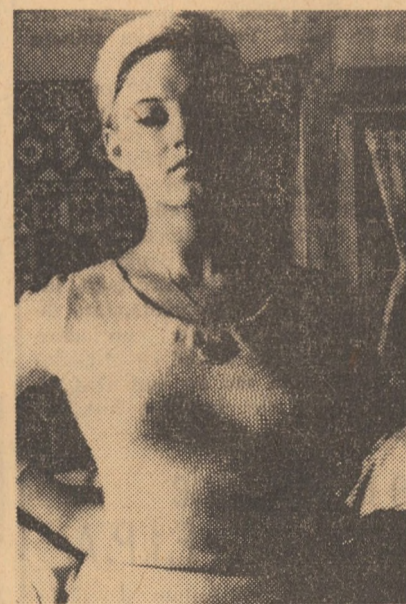
Actrița Jana Drchalova în filmul cehoslovac Vară capricioasă

AGNITA: 8 MAI: Cei șapte samurai (orele 10,00; 16,00; 18,00; 20,00). DUMBRĂVENI: 7 NOIEMBRIE: Valetul de pică (orele 18,00 și 20,00).