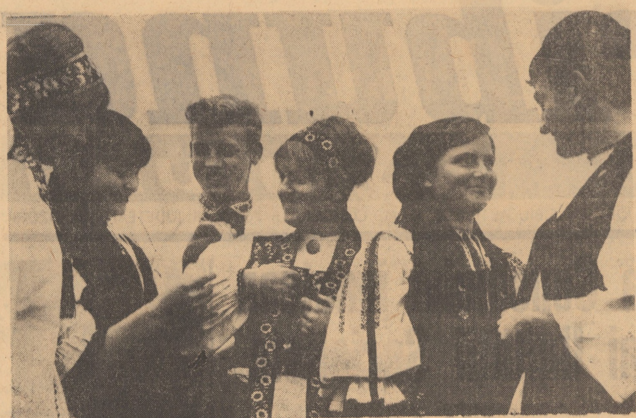
Zimbetul luminos al prieteniei

Adunarea, a constituit un prilej de afirmare a adevăratei entuziasme a celor prezenti pentru linia politică înțeleaptă a partidului nostru.