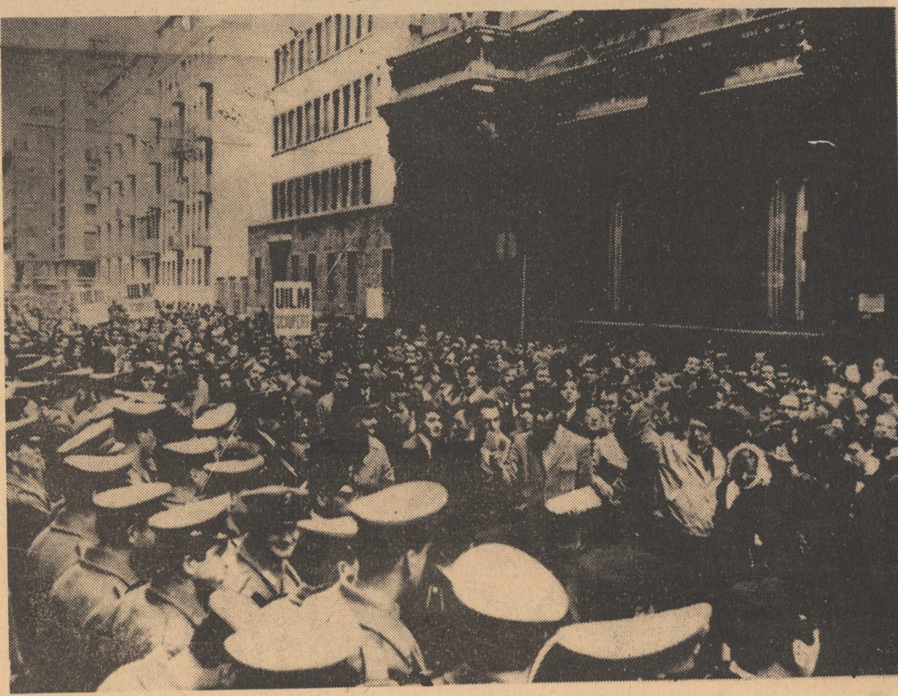
ITALIA: Instantaneu surprins la Milano în timpul recentei greve generale declanșată împotriva sistemului ineficient de pensionare

Expunerea înscrinutului cu a-faceri ad-interim consacrată acestui eveniment a fost urmărită cu interes.