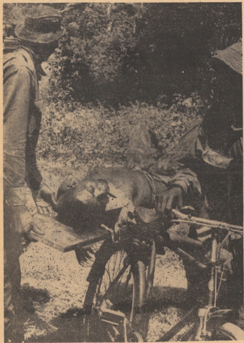
Instanțaneu pe frontul din apropierea Ekimului. Soldat nigerian transportat de camarazi după război

Prezidenții meteorologice pentru regiunea americană rîmîn favorabile. Administrația națională pentru probleme aeronautice și cercetarea spațiului cosmic a anunțat că, înainte de a fi transportați pe calea aerului la centrul spațial din Houston, cei trei cosmonauți vor rămîne 20 de ore la bază portavionului „Yorktown”, însoțit de conducerea operațiunilor de recuperare care se vor desfășura, pentru prima oară în istoria zborurilor cosmice americane, pe întineric.