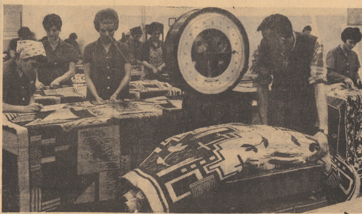
Prin miinile iscusite ale repansatoarelor de la fabrica „Dumbrava” din Sibiu, trec zilnic peste 4500 metri pătrați de covoare.