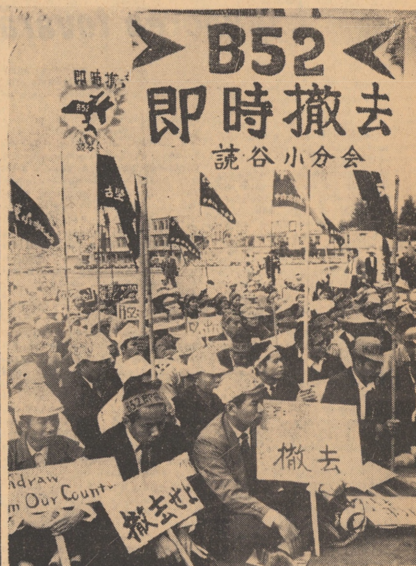
Aspect din timpul marii demonstrații a profesorilor la baza americană Kadena împotriva existenței pe teritoriul Okinawei a bombardierelor gigant tip „B-52”; demonstrația a fost însoțită de o grevă de 12 ore