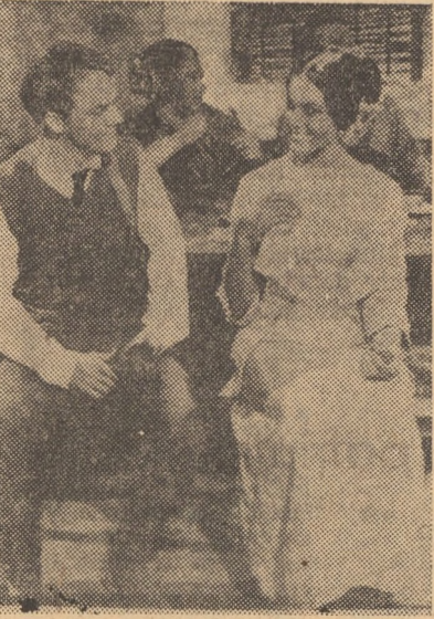
Cadru din filmul Un glonte pentru general care rulează la cinematograful „Pacea” din Sibiu