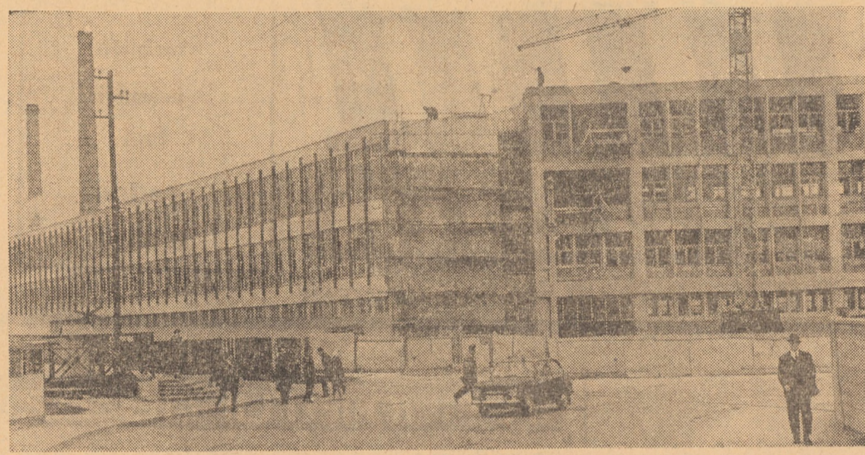
În curînd, fabrica „Libertatea” din Sibiu va adăuga peisajului industrial noi elemente prin construcțiile moderne, prin lărgirea spațiului productiv.

Toate aceste realizări, obținute până în prezent în tehnica feroviară, sînt rodul fecund de creație materială și spirituală a harnicului nostru popor, condus de partid.