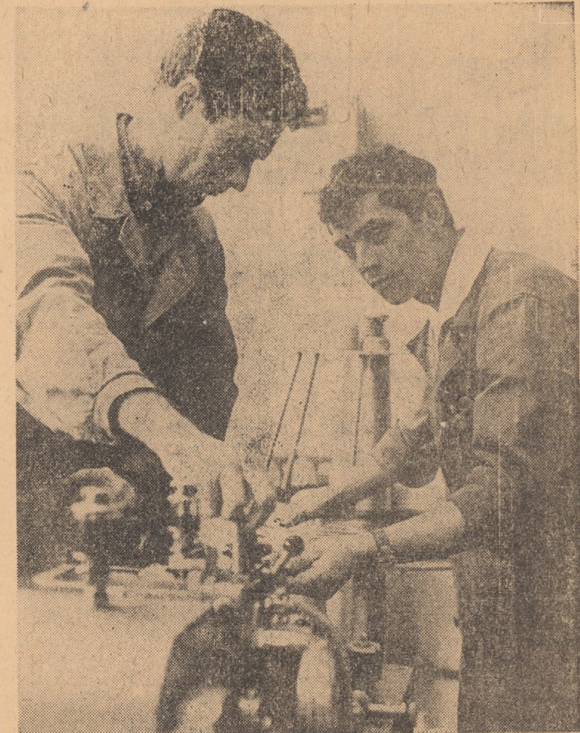
Fabrica „Flamura roșie” Sibiu. O nouă mașină de ambutat vîrfuri pentru mine-pastă, asigură semibabricatele necesare realizării producției care, lunar, se cifrează la peste 2 milioane bucăți