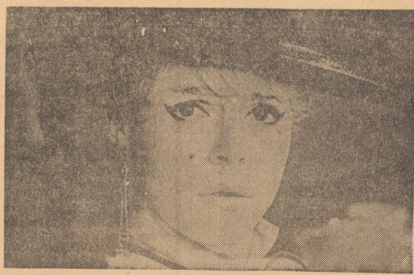
Protagonista filmului Pensune pentru holtei