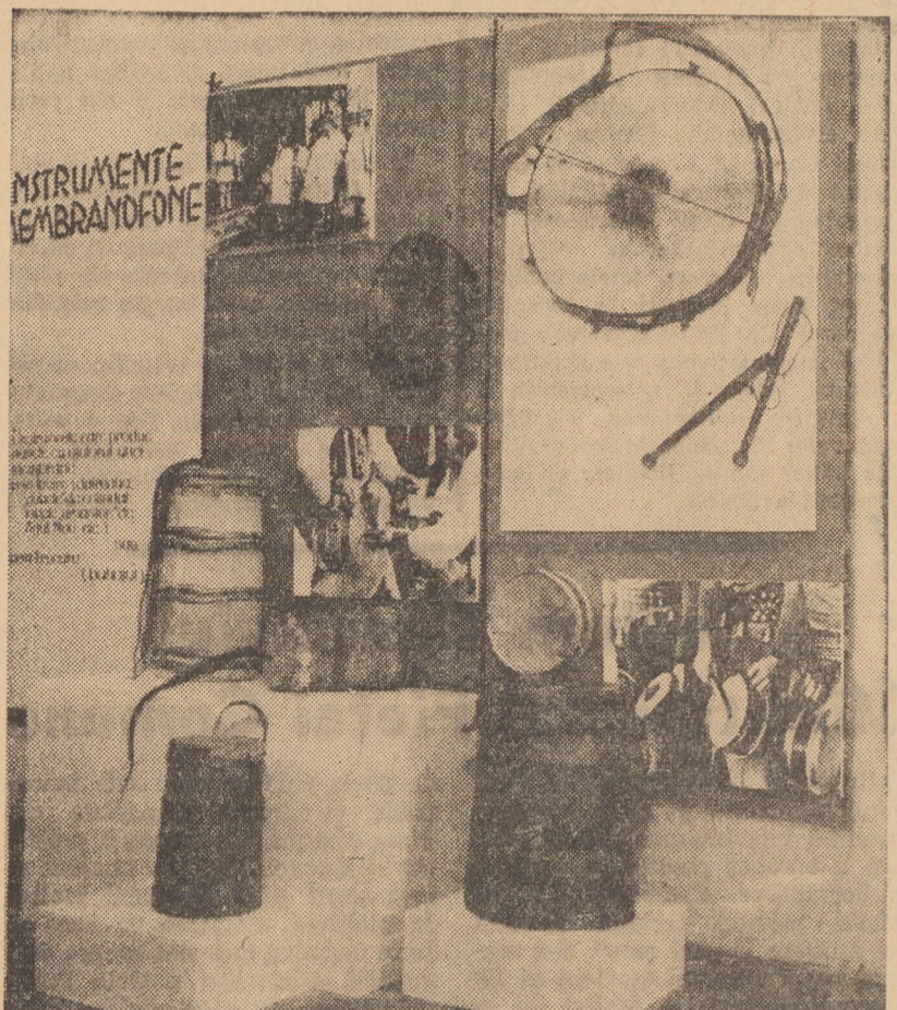
Detaliu din expoziția de instrumente muzicale populare, deschisă la Casa Artelor din Sibiu

Dar, prin impresia de ansamblu, volumul Clopotele de apă recomandă un prozator de vocație, căruia îi așteptăm naratiuni mai ample, analitice în primul rînd.