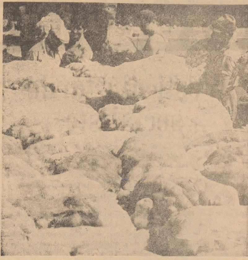
Întreprinderea de legume și fructe Sibiu. Un nou lot de pasăre sosită la centrul de deshidratare din Dumbrăveni unde sînt prelucrate 24 tone materie brută pe zi.

Adunările și conferințele de dări de seamă și alegeri trebuie să ducă la ridicarea pe o treaptă superioară a întregii activități, la întărirea și perfecționarea rolului de conducător al fiecărei organizații din județul nostru.