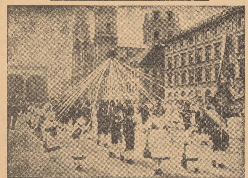
R.F. A GERMANIEI. Cel mai mare festival mondial al berei și al veseliei s-a deschis la München, pe Theresienwiese pe timp de 16 zile. Organizatorii speră ca la festival să vină aproximativ 5.000.000 de vizitatori. În fotografie: aspect de la parada de deschidere

PNOM PENH 2 (Agerpres). — Agențiile de presă relatează că forțele populare de rezistență cambodgiene desfășoară largi acțiuni ofensive împotriva trupelor regimului Lon Nol. Atacurile lor se desfășoară în prezent de-a lungul șoselei nr. 5, care leagă Pnom Penh de provincia Battambang, una din cele mai bogate regiuni în cultură de orez. De asemenea, forțele patriotice cambodgiene au atacat în ultimele 24 de ore pozițiile trupelor regimului Lon Nol în localitățile Sandan, Tuk Laak și Salalek Pram, situate în apropierea capitalei. O altă importanță cale de acces spre capitală — șoseaua nr. 4 — este, de asemenea, atacată de forțele populare de rezistență. Această șosea este singura pe care se face aprovizionarea capitalei cu produse petrolifere.