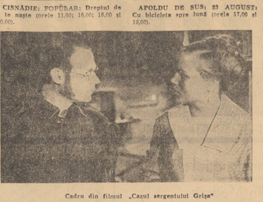
Cadru din filmul „Cazul sergentului Grișu”

firmat prin urmărirea în mod deosebit a actualilor clase a VIII-a. Aceste clase reflectă în comportarea de toate zilele unele din preocupările mai deosebite ale fostilor învățători din cl. I-IV. Ea o clasă se manifestă o puternică tendință a elevilor de a activa în afară de clasă, iar la altă clasă elevii manifestă interes mai mare în cadrul clasei.