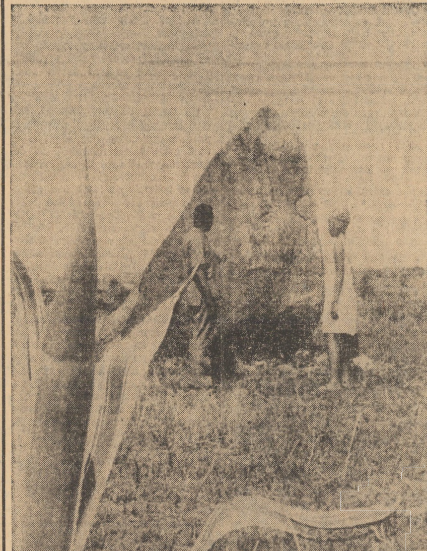
BURUNDI. Piatra ce se găsește pe locul întîlnirii remarcabililor explorații ai Africii — Livingston și Stanley din 1871. Acesta este unul din punctele de atracție de pe malul lacului Tanganyika, pe care n-o ocolește nici un călător