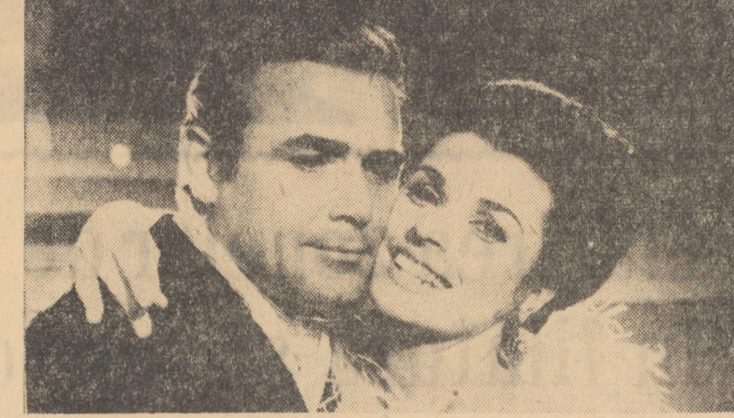
Cadru din filmul Picior lung, degete lungi

AGNITA: 8 MAI: Prea mic pentru un război atit de mare (orele 10,00; 16,00; 18,00).