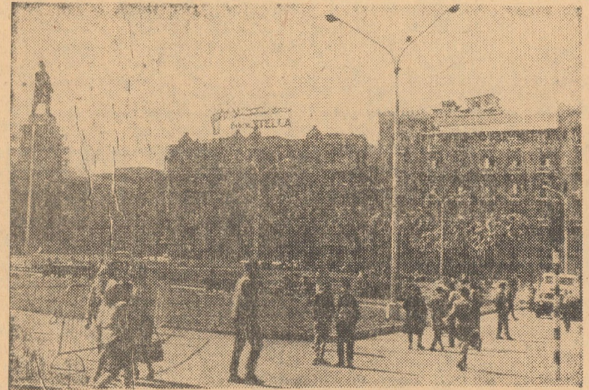
R.A.U. Alexandria este al doilea mare oraș al țării și cel mai important port al R.A.U. la Marea Mediterană. În foto: una din pietele centrale unde a fost ridicată statuia lui Mohamed Ali

fost înregistrate pierderi de vieți omenești.