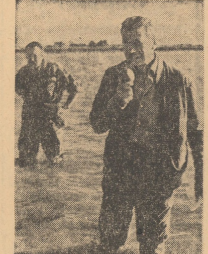
Cadru din filmul „A trăi pentru a trăi”