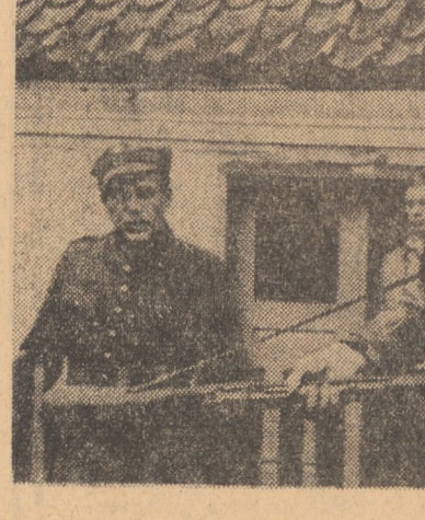
Cadru din filmul Meridianul zero

Centrul meteorologic Sibiu comunică: vreme în general frumoasă, dar rece noaptea și dimineața, cu