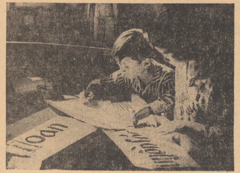
VIETNAMUL DE SUD — În regiunea eliberată Quang Tri, copiii pregătesc aișe cu „Bun venit pentru revoluționari”

„Putem constata cu satisfacție că influența sindicatelor a crescut considerabil după Congresul al VIII-lea al partidului în toate sferile vitale de activitate — în economie și știință, în politica socială, în cultură și artă”. Referindu-se, în continuare, la sarcinile economice, după subliniat dezvoltarea echilibrată și continuă a economiei R.D.G., vorbitorul a spus: „Aici, prima sarcină este, în mod firesc, să se realizeze și să se depășească obiectivele fixate de stat. Planul real nu este planul comod, dimpotrivă, el implică inițiativa oamenilor muncii, capacitatea lor de a înlătura obstacolele ce le stau în cale. Pe de altă parte, soluții care nu figurează decât pe hîrtie nu ajută nimănui. Obiectivele trebuie să fie realizate. Avem nevoie de sarcini sporite pe care muncitorii le acceptă și, în acest context, la nașterea unei probleme importante, indisolubil legate de îndeplinirea sarcinii principale. Desigur, dorim cu toții o îmbunătățire a ofertei bunurilor de consum pentru populație. În acest scop, există de pe acum realizări. Rămîn, totuși, multe de făcut”. „Cu cît vom progresa în consolidarea proporțiilor economice, cu atît mai necesar și posibil va fi să se stu-