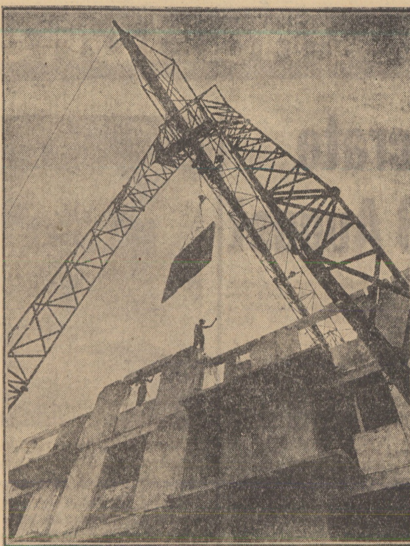
Se ridică blocul „T 13”, cu 60 apartamente, în micro-raionul Hipodrom II din Sibiu

Sibiul nu e o excepție. La lucrările de împăduriri tinerii au plantat mîndrie pe 70 ha. Au strîns 7000 tone de seuri metalice. La Șeica Mare, Tălmăciu, în aproape toate localitățile au fost alături de vîrstnici în acțiunile de lucrări edilitare-gospodărești, obținînd rezultate deosebite. La Avrig 18 ha terenuri agricole au fost desecate cu sprijinul efectiv al tinerilor. 4.500 elevi au fost prezentați pe ogoare în cam-