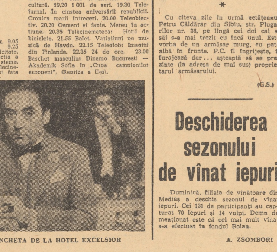
Cadru din filmul ANCHETA DE LA HOTEL EXCELSIOR

La Teatrul de stat din Sibiu, ora 19,30, va avea loc premiera piesei Fur-tuna (limba germană), abonament P.