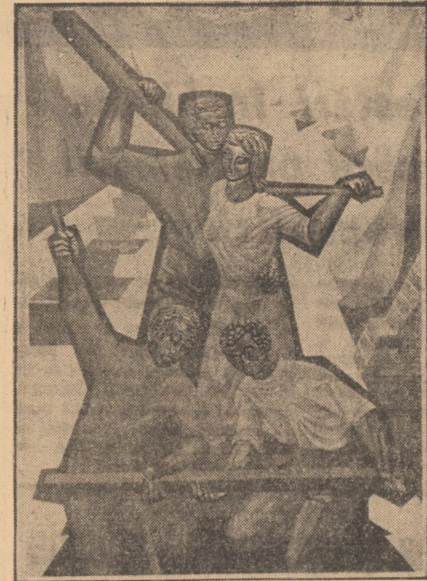
„Șantier” Erwin Kuttler — tehnică mixtă