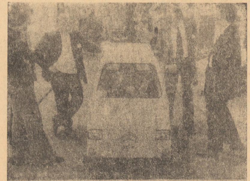
ELVEȚIA. — „Mini-contesa” este numele noului mini-automobil francez prezentat de curind la Tîrgul invențiilor de la Geneva. Dimensiunile acestei „mașinuțe” înzestrate cu motor electric sint: 1,70 m lungime, 90 cm lățime și 1,25 m înălțime. Motorul, cu o putere de 1200 wați poate dezvolta o viteză maximă de 45 km/h. În foto: Curiozitate și amuzament în jurul „Mini-contesei” itanceze cu un singur loc și rezervă pentru un bagaj de 50 kg sau... doi copii

Haga 5 (Agerpres). — Luni seara, regina Juliana a Olandei a încredințat lui Marinus Ruppert sarcina studiului posibilităților de formare a unui nou guvern, în urma alegerilor generale de la 29 noiembrie. Ruppert este membru al Consiliului de Stat din 1969 și face parte din partidul bestului premier Bernd Biesheuvel. Suverana olandeză a luat această hotărîre în urma consultărilor avute cu 14 personalități politice, printre care liderii grupurilor parlamentare și partidelor politice. De menționat că senatorul Wilhelmus de Jaay Fortman a respins născuții de formare a unui guvern. Reamintim că, pînă la alcătuirea unui nou cabinet, afacerile curente ale Olandei sint rezolvate de fostul guvern Biesheuvel, sub statut juridic de guvern interimar.