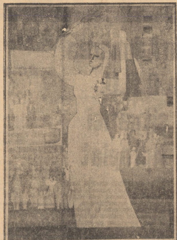
„Republica — 30 Decembrie” Nicolae Iorga — ulei