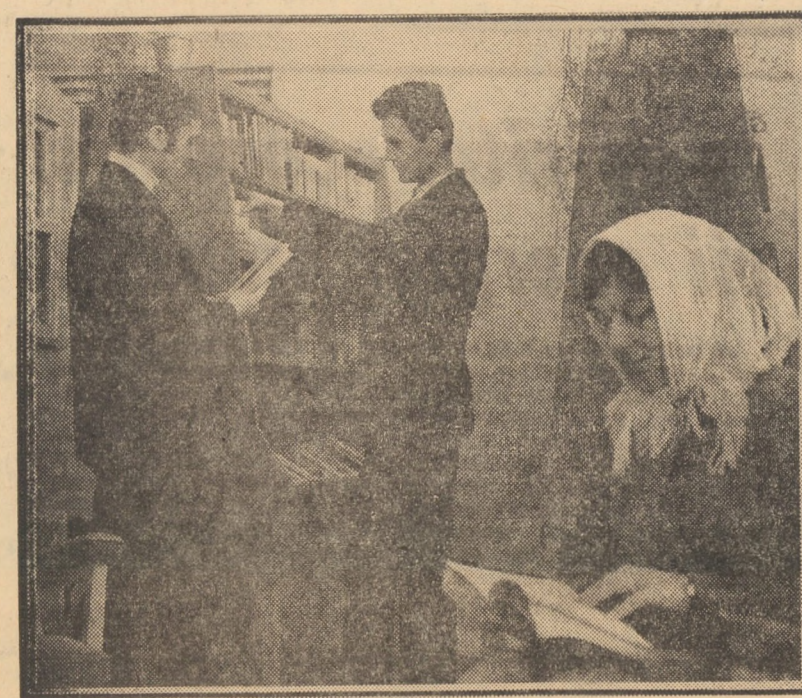
Zilnic, biblioteca de la Casa de cultură din Cisnădie este vizitată de numeroși cititori