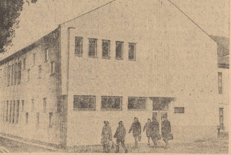
Odată cu darsa în folosință a noului corp de clădire, cuprinzînd atelierul Grupului școlar M.I.U. Sibiu, numărul locurilor de muncă a fost suplimentat cu încă 150, asigurându-se totodată o mai bună organizare a fluxului tehnologic. În fotografie: noua construcție, cu o suprafață de 600 mp.

Tovarășul Costică Porfime, prim-secretar al Comitetului municipal de