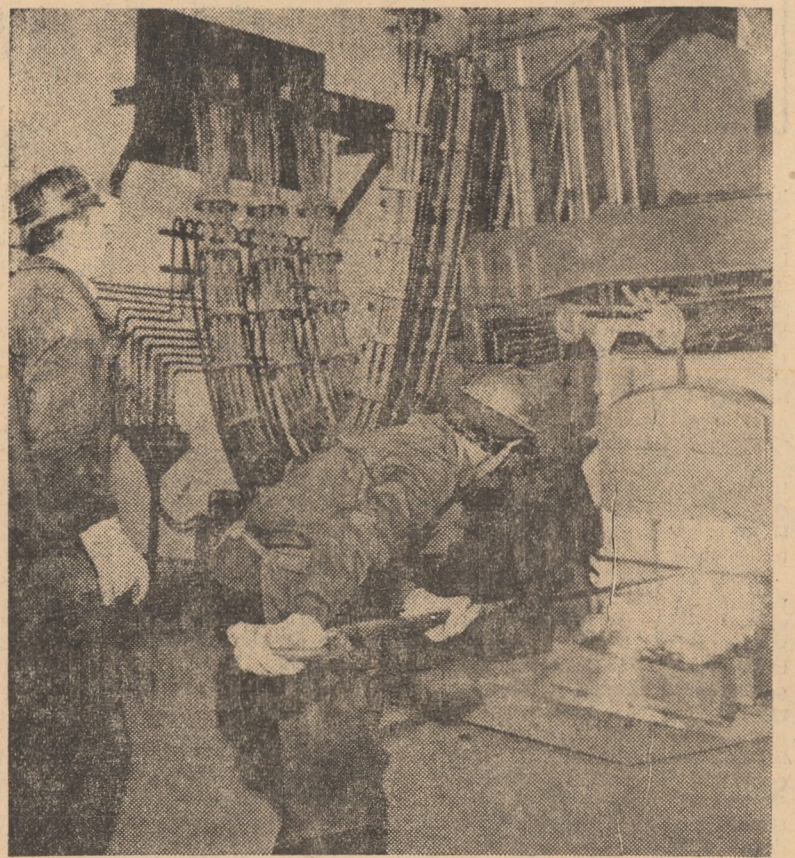
La gura capturului electric cu arc, cu o marcată de 3 tone, din noua ofierărie de la „Independența” Sibiu.

Ieri, la amiază, eveniment de mare rezonanță pe țara noastră industrială a Sibiului, acolo unde de constructorii au înălțat noi uzine pe care le-au botezat după numele surorilor lor mai vechi și cu aură în munții nostri — „Balanța” II și „Independența” II. Sîrulii premierelor tehnice care au urmat ridicării noii uzine industriale și-a adăugat prilejul să vorbim cu intensă bucurie și satisfacție pentru constructorii și beneficiarii: realizarea primei șarje — a șarjei de probă — la captorul electric cu arc pentru topit oțelul cu capacitate de 3