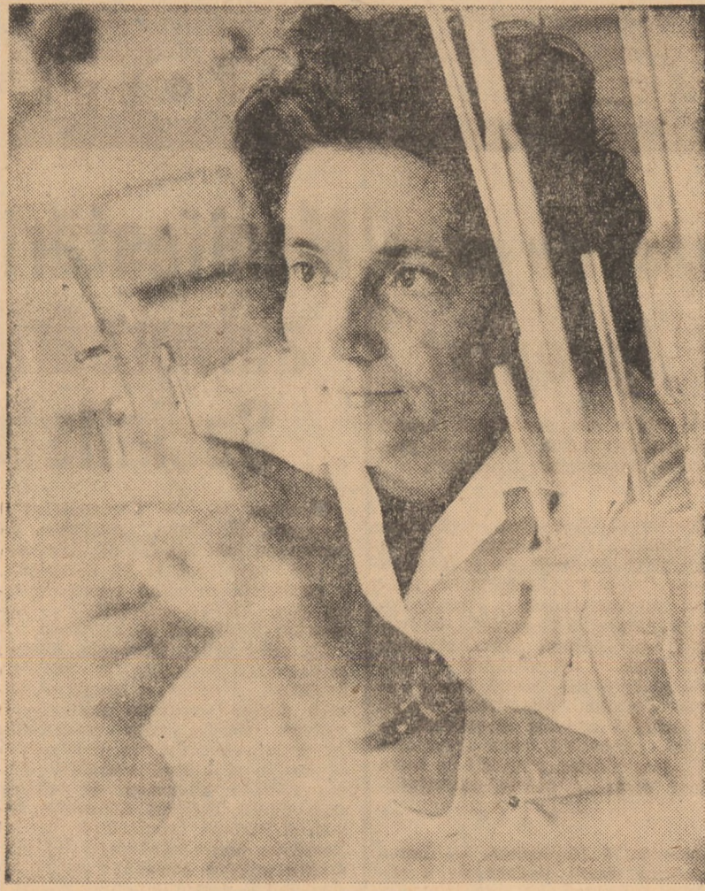
I.C.R.A. Sibiu, figurează determinările organoleptice la conserve, legume, fructe, produse zaharose, băuturi, brinzeturii, preparate din carne...