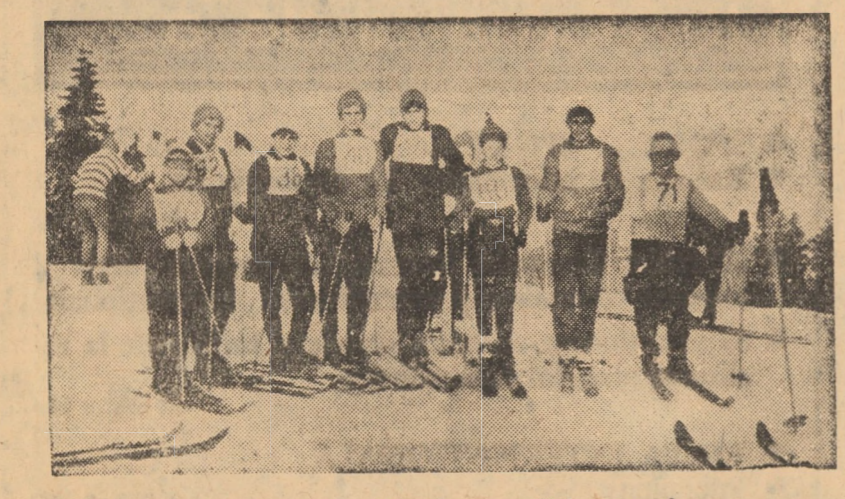
„Ciobănașii” din Rășnari, așteaptă cu nerăbdare startul...