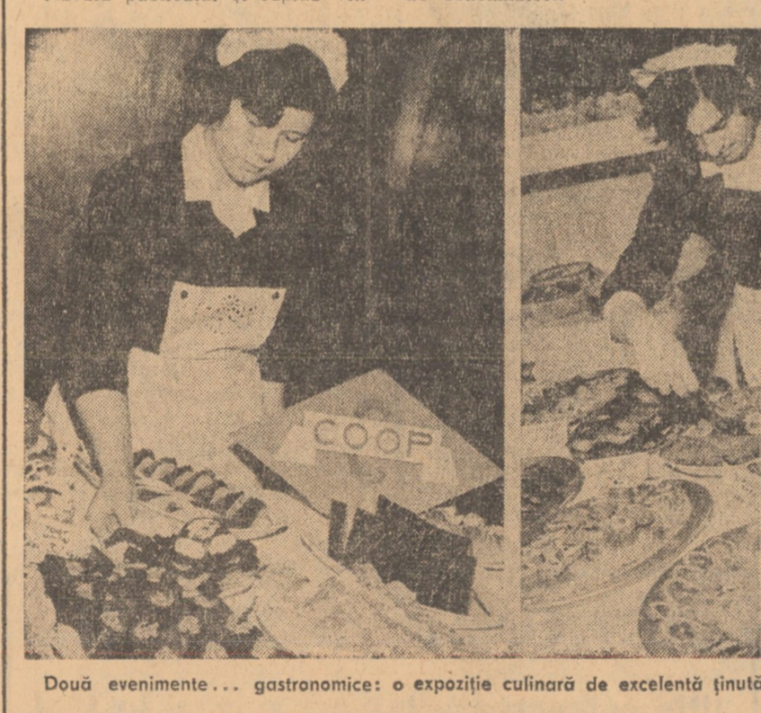
Doi evenimente... gastronomice: o expoziție culinară de excelență ținută și un nou local „Gospodina”, care promite să fie mereu fruntea...

Cum mai spuneam, în șirul evenimentelor comerciale din ultima vreme, o expoziție culinară la „Impăratul Romanilor” avea șansa să reprezinte un punct deosebit al spectacolului.