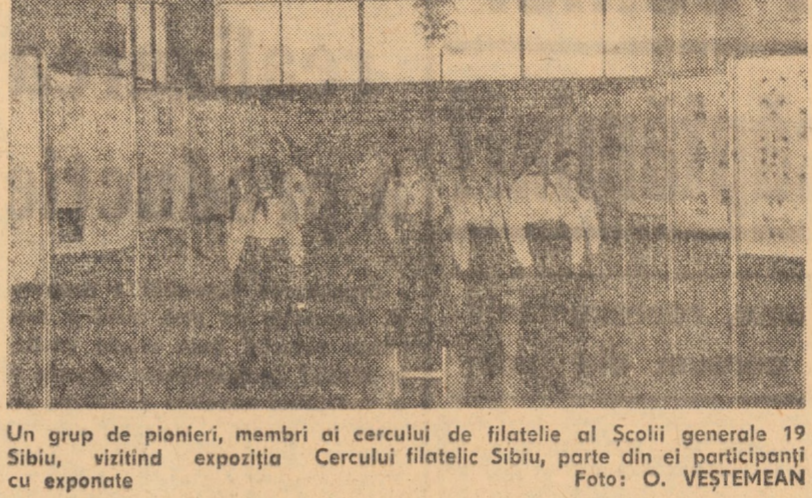
Un grup de pionieri, membri ai cercului de filatelică al Școlii generale 19 Sibiu, vizitând expoziția Cercului filatelic Sibiu, parte din ei participând cu exponate

de la înființarea primelor detașamente de pionieri din țara noastră și alte asemenea acțiuni. Membrii acestui cerc nu vor precupeți timpul lor liber și se vor pregăti serios prezentând o tematică bine aleasă și bine documentată. Ar fi de dorit ca un număr cât mai mare de pionieri și școlarii din județul nostru să-și folosească și ei timpul liber în felul acesta, dând ca exemplu pionierii de la Șc. gen. 19, care au avut - și nu ne îndoiim, vor mai avea - adevărate satisfacții în această direcție.