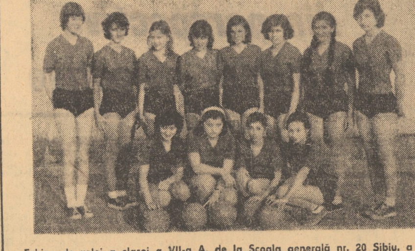
Echipa de volei a clasei a VII-a A, de la Școala generală nr. 20 Sibiu, a ocupat locul I (tur) în campionatul școlii. Cite dintre aceste micuțe voleibaliste vor deveni „senioare“ în echipa C.S.M. Sibiu?