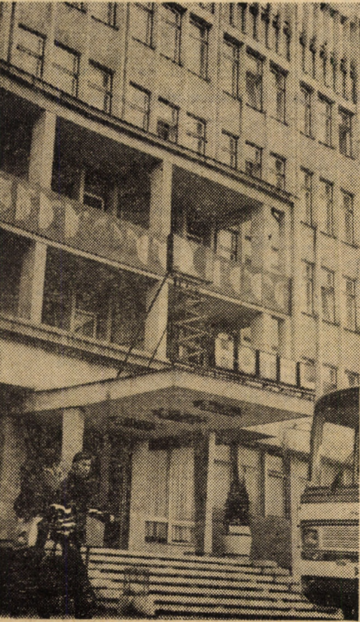
În peisajul citadin al Mediașului, hotelul „Central” aduce o notă în plus de eleganță și frumusețe