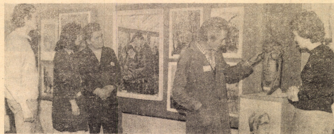
De cîteva zile, la clubul din incinta Fabricii de geamuri Mediaș, artiștii plastici medieșeni alături de fotograful din întreprindere, și-au unit lucrările de pictură, grafică, sculptură și foto într-o reușită expoziție. Exponatele se bucură de unanimă apreciere din partea colectivului de muncitori și tehnicieni din întreprindere

Iubitorii melodiilor „Cu parfum de romanță”, a cîntecului de petrecere, a vechilor balade transilvănene, canțonetei, valsului și poeziei sînt invitați la „Serile de romanțe și poezie” în fiecare vineri seara, pe terasa clubului sibian „Independența”.